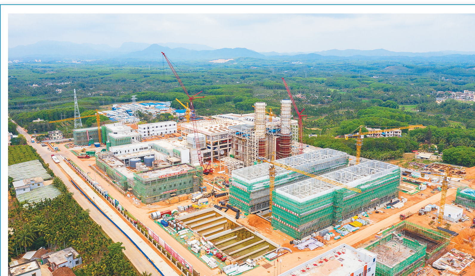
大唐万宁燃气发电厂： 1号机组进入安装阶段

据介绍，该笔跨省并购上市公司金融业务成功落地，对海南自贸港经济建设中的优质项目资金金融通具有积极示范作用。