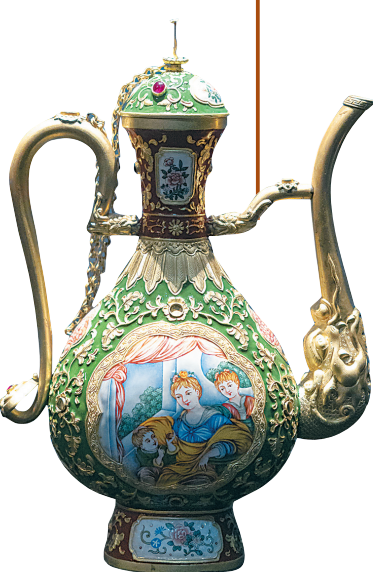
展品《珐琅彩提梁壶》

如今，花丝镶嵌楚钹子品牌落户海南自贸港，并把86件珍品呈现在市民游客面前，一展中国非遗之美。“花丝镶嵌是最顶层的国家级非物质文化遗产之一，早已成为国礼，是备受欢迎的中国绝技，不少国家皇室都收藏有花丝镶嵌珍品。我们想通过海南自贸港这一窗口，让全世界更多友人、游客了解花丝镶嵌，了解中国工匠精神，了解中国文化的厚重深远，让花丝镶嵌等国家非物质文化遗产更好融入‘一带一路’、更好走向世界，这是非常有意义的事情。”楚钹子说。