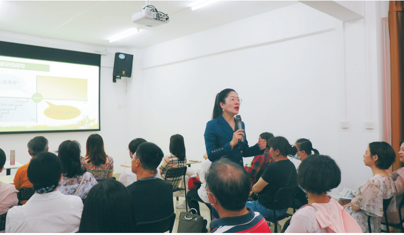
公益讲座现场。 海南日报读者俱乐部供图

贫好做法。 万宁市委相关负责人表示，该市将通过党史学习教育，进一步传承红色精神，发扬优良传统，激励引导全市各级党组织和广大党员干部，以昂扬姿态奋力推进全市经济社会发展再上新台阶，坚决扛起海南全面深化改革和自由贸易港建设的万宁担当。