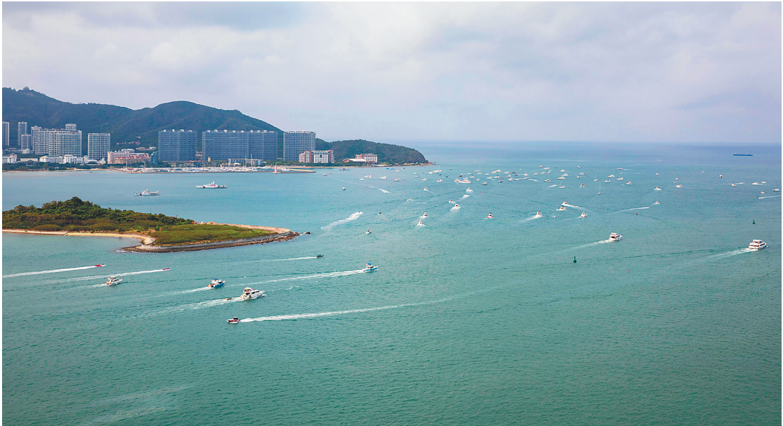
4月1日，俯瞰三亚中央商务区凤凰海岸游艇出海场景。三亚中央商务区作为海南唯一以邮轮游艇为主导产业的自贸港园区，目前已有30余家邮轮游艇企业入驻。

从投资类型看，以政府投资项目为主导，以社会资本项目为主体。三亚中央商务区的政府投资项目有59个，计划总投资约113亿元、占比21.7%，目前已累计完成并投资纳统21亿元；社会投资项目25个，计划总投资约407亿元、占比78.3%，现已累计完成并投资纳统69亿元。