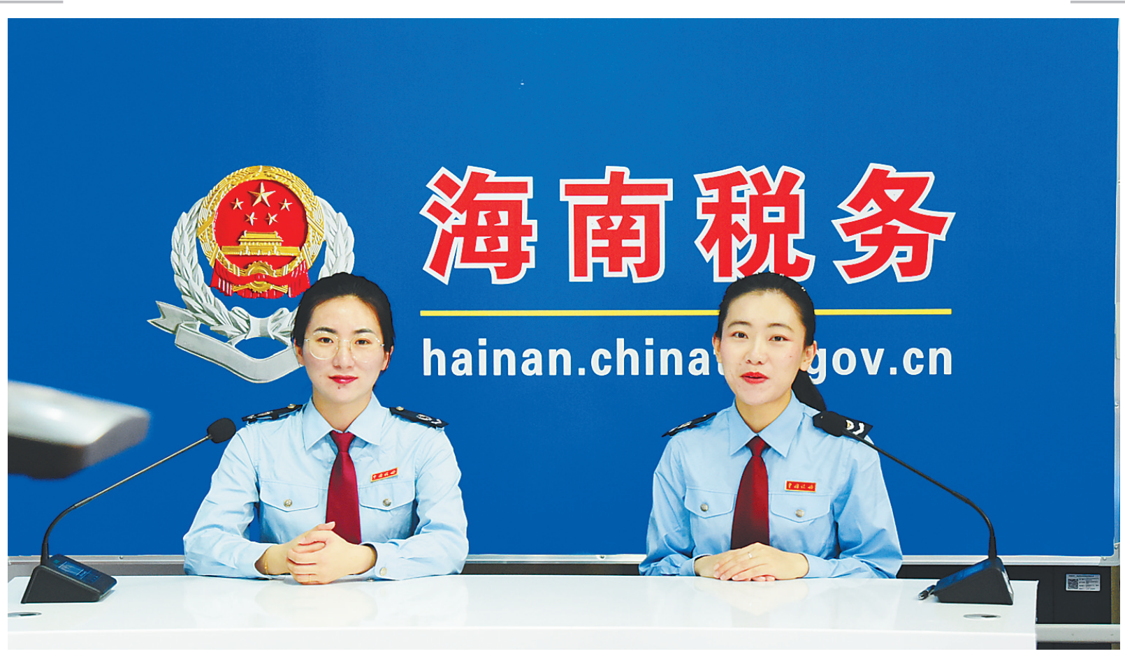
国家税务总局海南省税务局举行“税收惠民办实事 深化改革开新局”直播活动。

4月1日，国家税务总局海南省税务局以“税收惠民办实事 深化改革开新局”为主题的直播活动拉开了第30个全国税收宣传月活动的序幕。 在这一个月期间，海南各级税务部门将按照税务总局统一部署，围绕“税收惠民办实事 深化改革开新局”主题，一方面将税收宣传月活动作为全国税务系统庆祝建党100周年、开展党史学习教育、抓好“我为群众办实事”实践活动的重要举措，通过践行以人民为中心的发展思想，着力解决纳税人缴费人的堵点、难点、痛点问题，办好惠民实事；另一方面紧扣《关于进一步深化税收征管改革的意见》，以税收宣传月为契机深入推进精确执法、精细服务、精准监管、精诚共治，提高税法遵从度和社会满意度，为实现“十四五”良好开局、开启全面建设社会主义现代化国家新征程作出税务新贡献。 1992年2月24日，原国家税务总局印发《关于开展“税收宣传月”活动的通知》，决定从1992年起，将每年4月定为全国税收宣传月，扩大税收宣传影响，增强宣传效果。