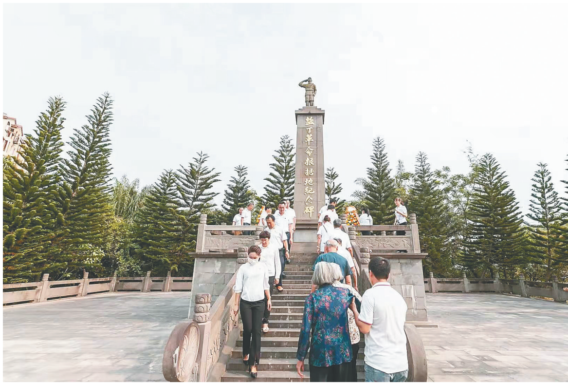
党员干部怀着敬仰之情缓步绕行纪念碑一周。