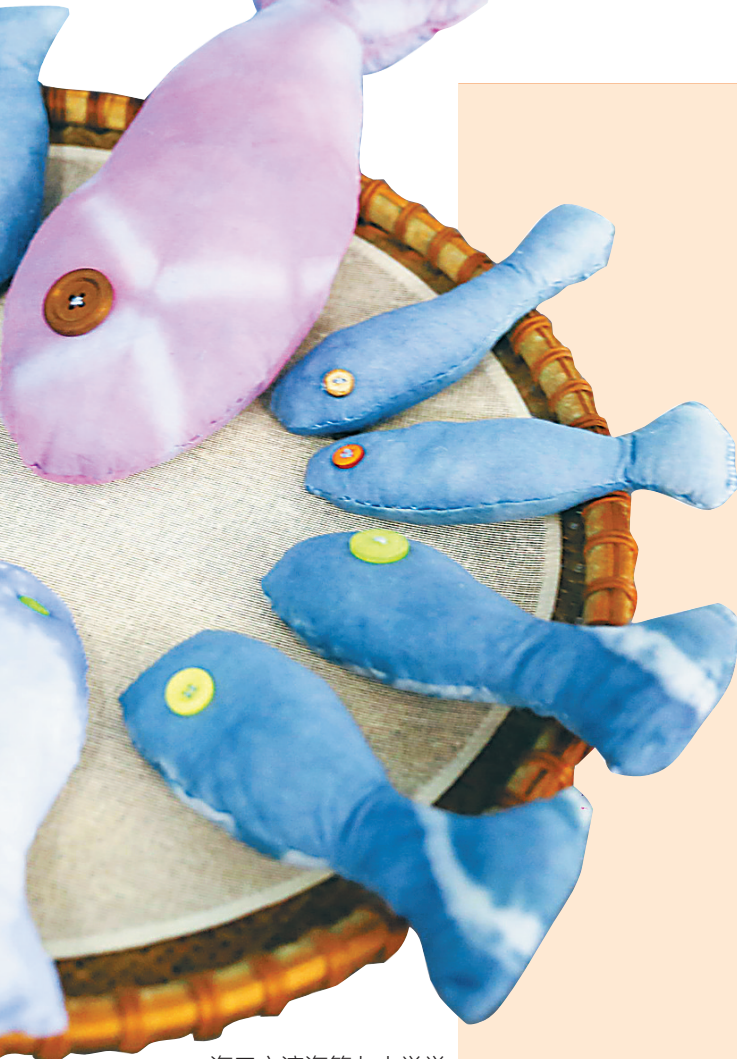
海口市滨海第九小学学生制作的蓝染工艺品。