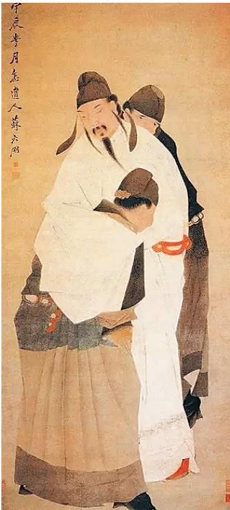
苏六鹏的《太白醉酒图》(清)

短视频流行的时代，人们对图像的热情，仿佛远远超过了对文字的热情。加上各种技术手段的发达，比如考古学家利用现代科学方法复原古人类的相貌，也加深了人们对古人，特别是对历史文化名人相貌的好奇。日常生活里，我们对于一个人的最直观的印象就是他的样貌。所以虽然古人没有机会留下照片，我们依然忍不住会去想象那些我们熟悉的古人是什么样子的。去年底，李白的《将进酒》遗书重现天日，狂傲豪迈，疑似原稿，引发了新一轮对李白相貌和生活的探索狂欢，并持续至今。