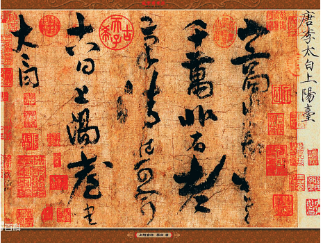
李白书法作品《上阳台帖》(局部)。