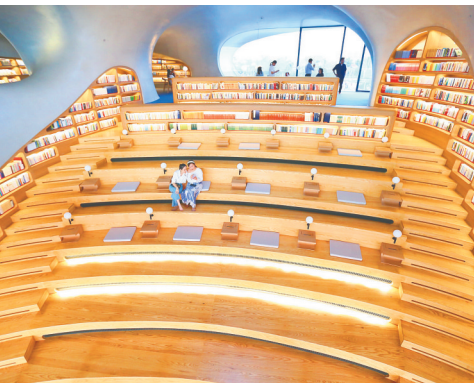
海口晓岛内部空间独具特色。