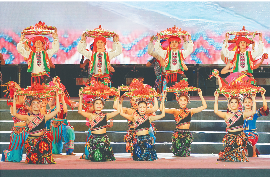
2021年三亚“三月三”系列活动开幕式暨主题文艺晚会现场。

本报三亚4月12日电（记者徐慧玲）4月12日晚，2021年三亚市庆祝海南黎族苗族传统节日“三月三”系列活动开幕式暨主题文艺晚会在三亚天涯海角游览区举行，以天为景，以海为幕，为黎族苗族同胞与八方宾客奉献了一场民族文化盛宴。 三亚“三月三”系列活动开幕式暨主题文艺晚会以“黎苗儿女颂党恩，幸福花开映天涯”为主题，内容丰富，涵盖了歌曲演唱、民族舞蹈、快闪表演，中间还穿插了讲述少数民族故事的视频短片。