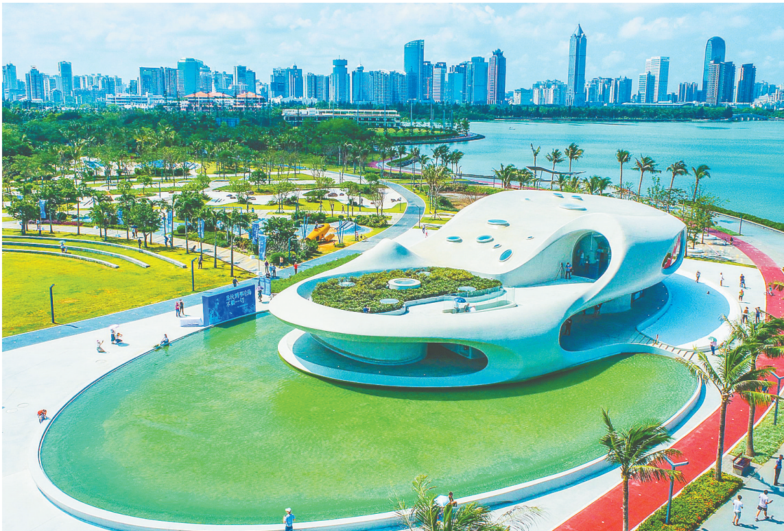
位于海口世纪公园音乐广场西北侧的“海口晓岛”公益阅读空间。

面积约1400平方米，是继北京之后全国第二个晓岛。从功能分区方面来看，其中约900平方米为高质量阅读空间，精选了约一万册经典图书供大众免费阅读，涵盖文学、历史、哲学、社会科学、艺术等门类，大众可通过预约免费入馆体验，因晓岛无低龄儿童适读书籍，暂不接受10岁以下儿童入内；约500平方米空间设置了卫生间、淋浴区、休闲座椅等设施，并配套无障碍厕所、母婴室