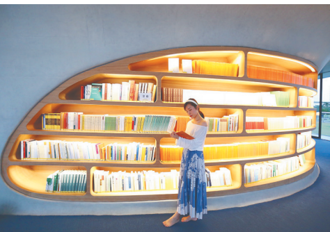
一位游客在海口晓岛内阅读书籍。