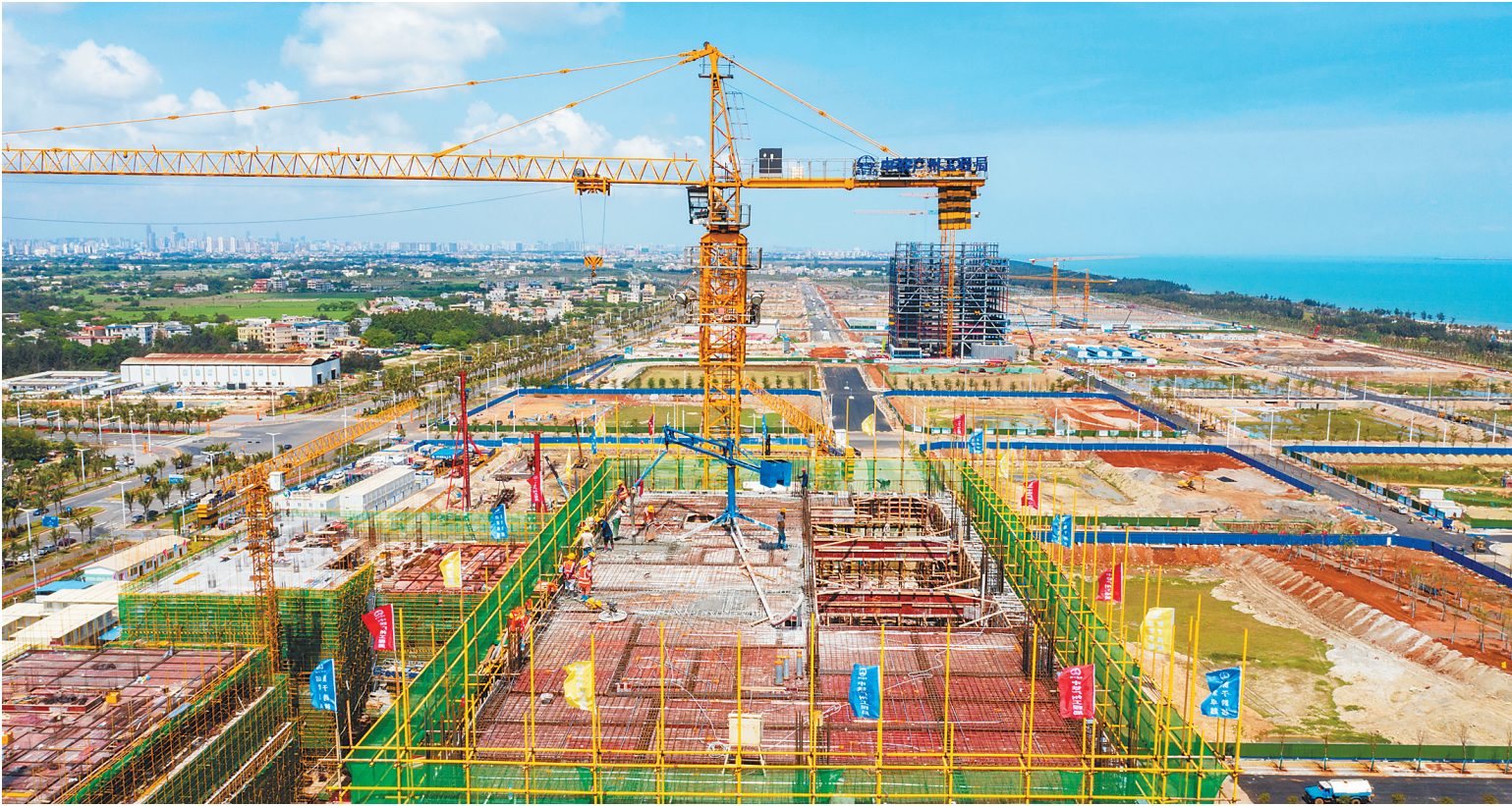
海口金融中心主体结构封顶

本报讯（记者王培琳 通讯员周恩赐 龔宝莉）今年以来，海南省公安厅港航公安局紧密结合琼州海峡水路通道卡口查控工作需要，积极依托5G等科技手段，高标准推进港航治安防控体系的智能化建设，与中国电信海南公司加强警务科技协作，依托5G数据技术，联合启动船舶5G智慧监控系统建设试点工作。近日，新海港2艘船舶部署安装的5G智慧监控系统投入试点使用。 通过在船舶安装5G智慧监控系统，实现对船舶人员、车辆有关数据采集研判、视频资源的实时传送等功能，有效地提高了公安管控工作效率，将治安管控手段从原先的码头卡口一线延伸到水上船舶，极大提升了警务效能。 此次5G智慧监控系统在新海港港口的上线运行，是5G业务在我省公安及港口航运业的第一例落地应用，也是我省利用5G新技术在港口智慧安防的一次有益尝试。