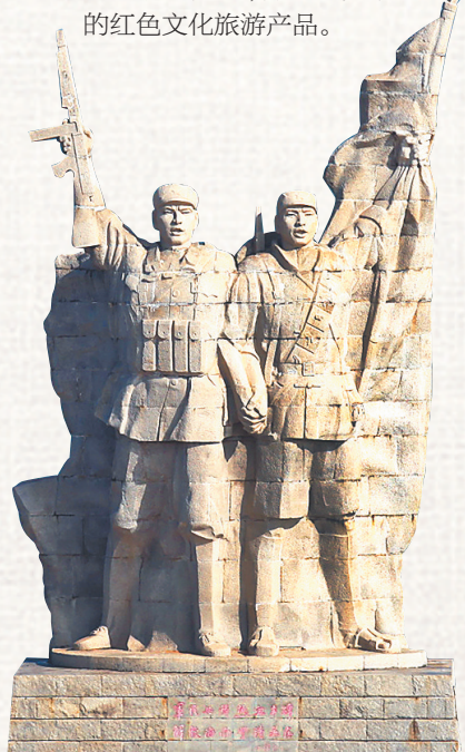
海南解放公园纪念碑。

第一天:海口琼崖一大会议址→冯白驹故居→拜访冯白驹将军后人分享革命往事→中国(海南)南海博物馆→琼海南强村→采摘水果 第二天:琼中百花岭→五指山革命根据地纪念馆→海南省民族博物馆→三亚红色娘子军演艺公园 第三天:三亚西岛旅游区→陵水苏维埃政府旧址 第一天:海口→临高海南解放公园→居仁瀑布→儋州力乍村→手工制作儋州特色杂粮美食→白沙起义第一枪旧址纪念馆 第二天:儋州石花水洞地质公园→昌江霸王岭国家森林公园→王下乡·黎花里 第三天:儋州海花岛→峨蔓火山海岸→东坡书院体验国学课 (赵辑)