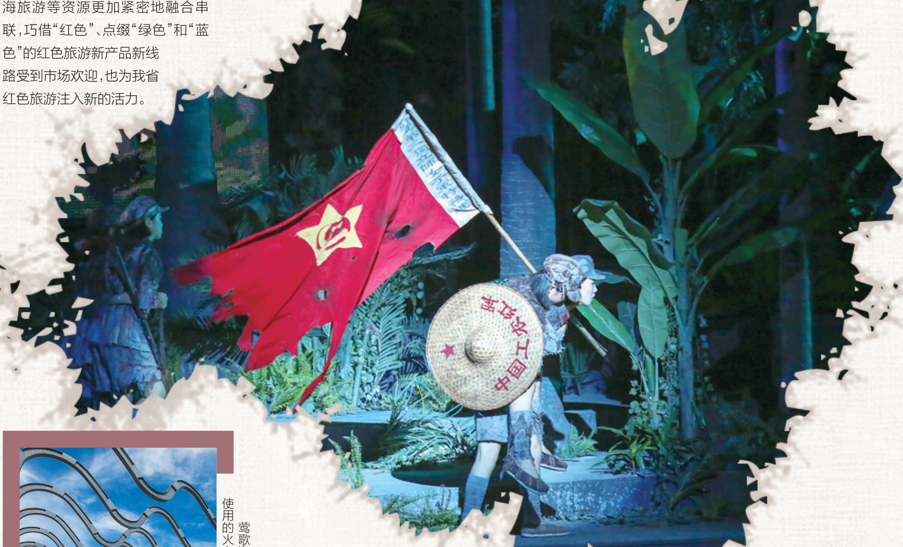
大型椰海青春实景影画·红色娘子军演出剧照。

依托现有的近500处红色文化资源优势,我省积极将红色旅游资源与丰富的绿色生态资源以及独特的海洋文化内涵深度融合,全方位展现出海南红色旅游旺盛的生命力。