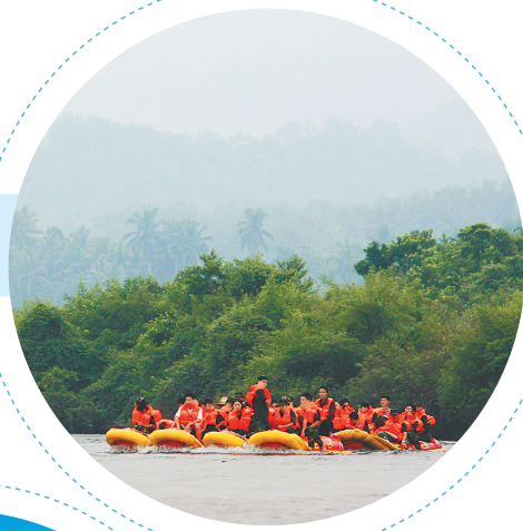
嘉积镇沿河而建。