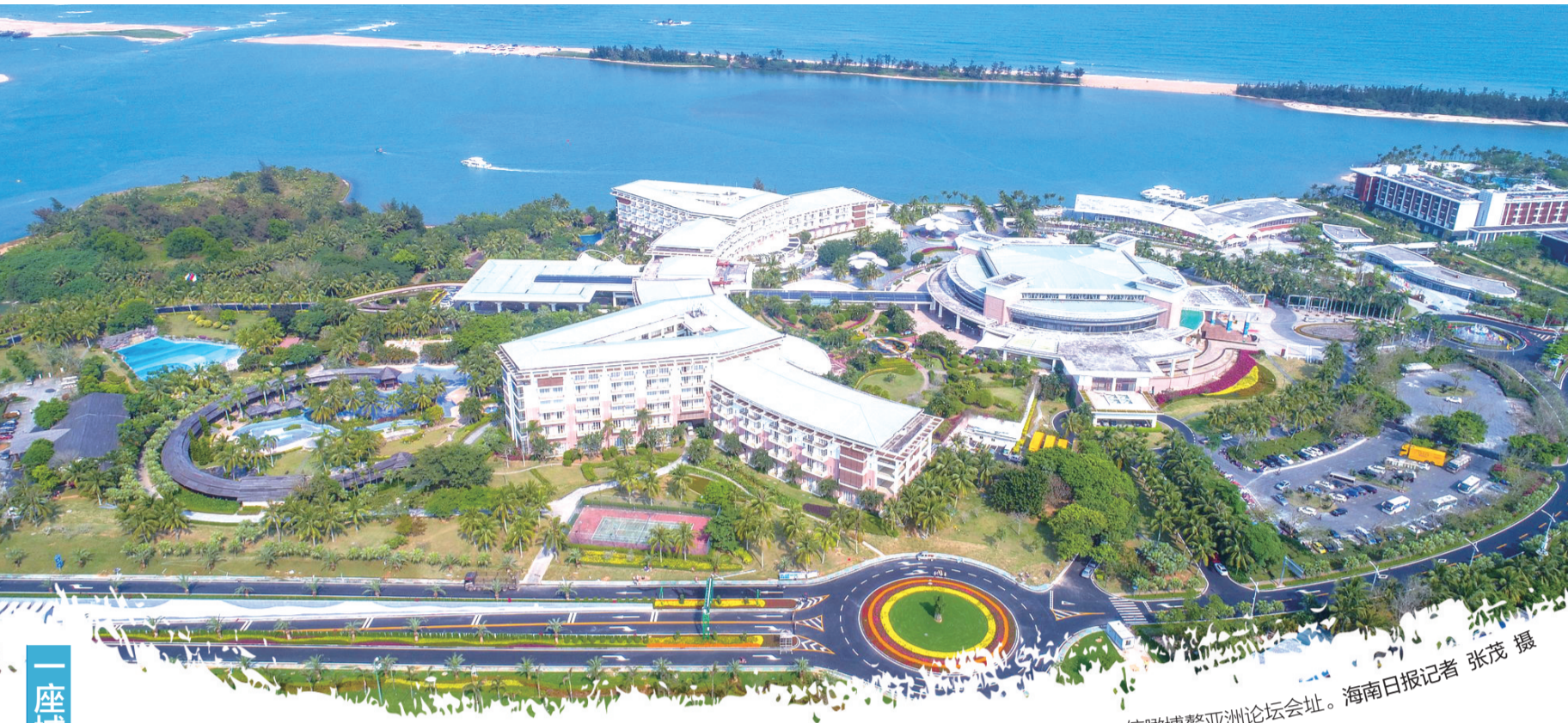
俯瞰博鳌亚洲论坛会址。