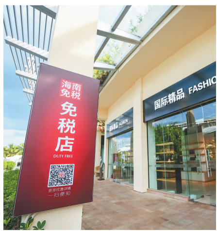
博鳌免税店。

随着首届博鳌亚洲论坛年会的顺利召开，仅有1.5万居民居住的小镇博鳌名扬天下，开始成为世界了解中国、了解海南的重要窗口。