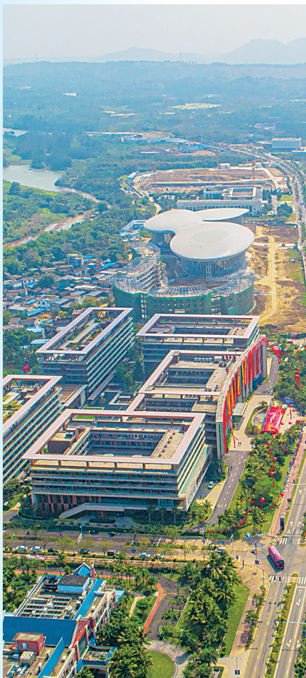
俯瞰博鳌乐城国际医疗旅游先行区。