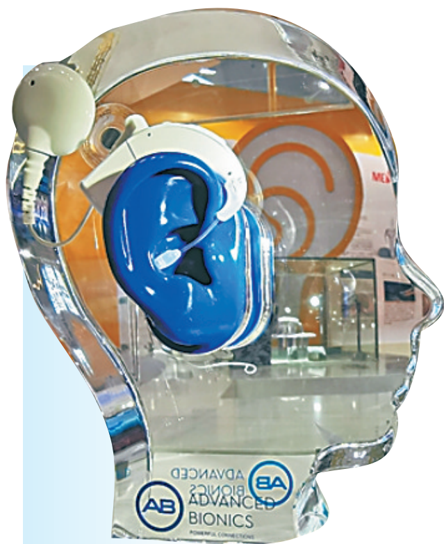
国际先进药械产品乐城亮相。 资料图