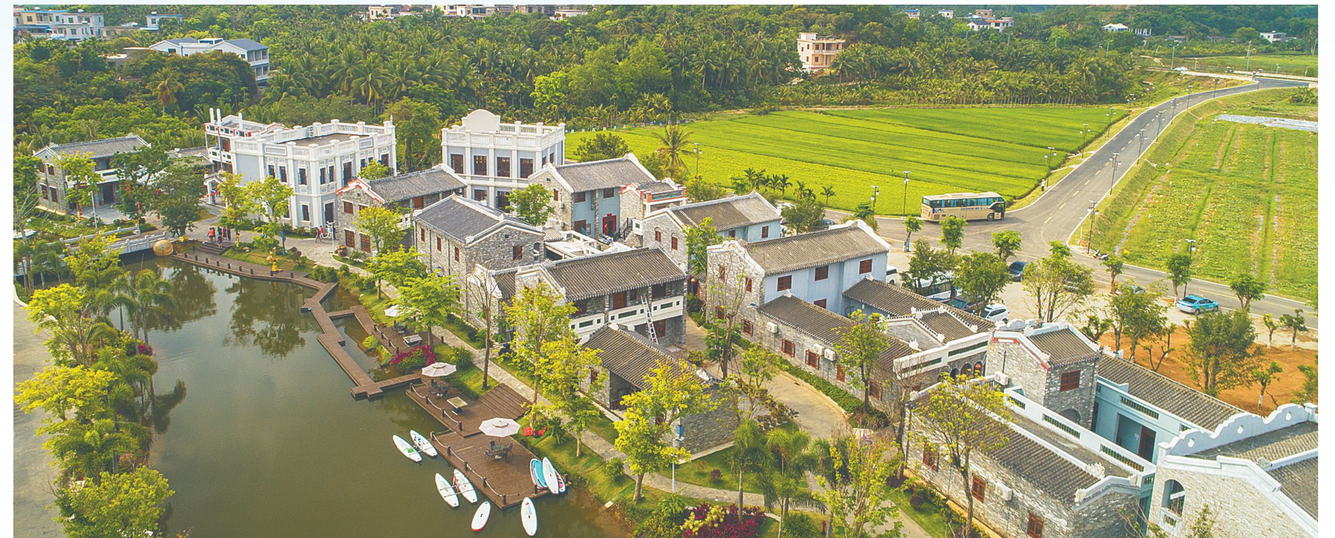
博鳌镇沙美村一角。

琼海市为本届年会着重打造的6个美丽乡村，担当起“美丽乡村会客厅”的职能，开门迎客，续写博鳌故事。