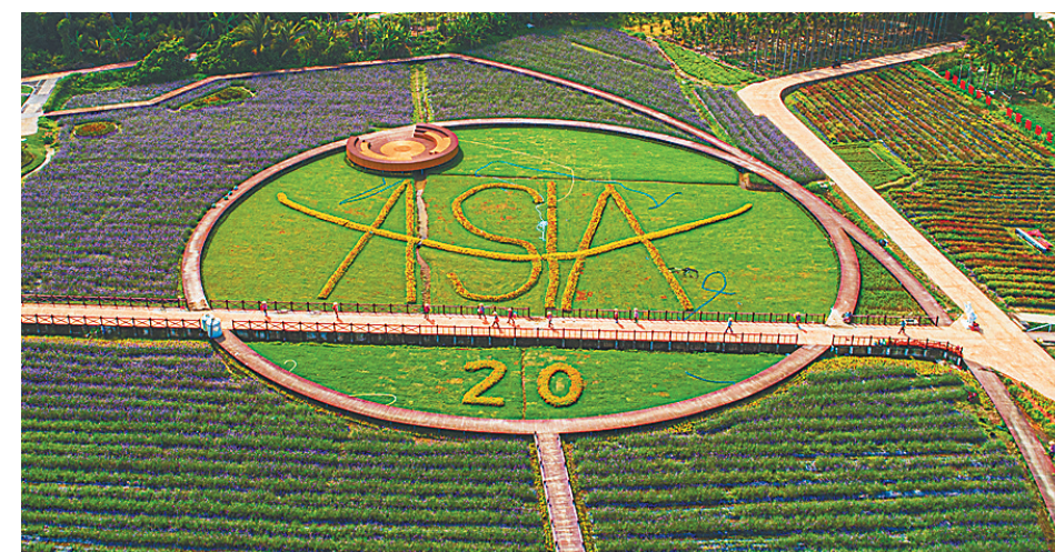
博鳌镇南强村田间。