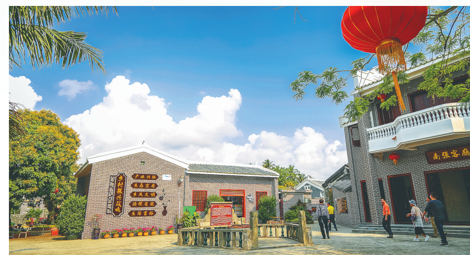
博鳌镇南强村会客厅。