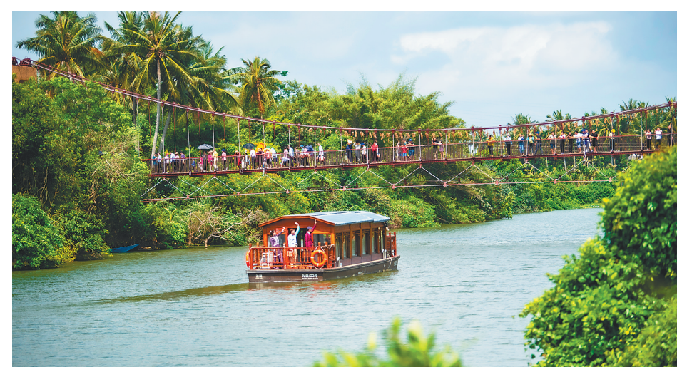
博鳌九曲生态公园，游客乘船游玩。