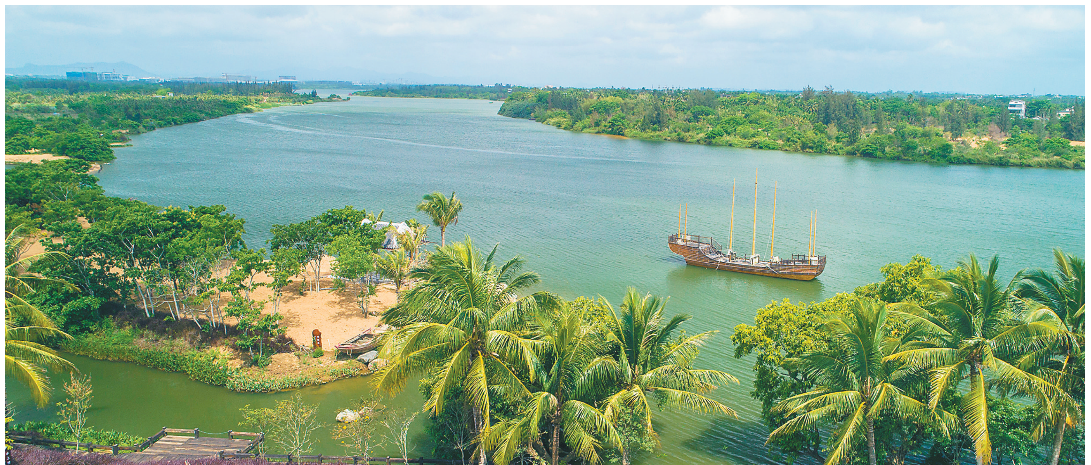
博鳌镇留客村风光。