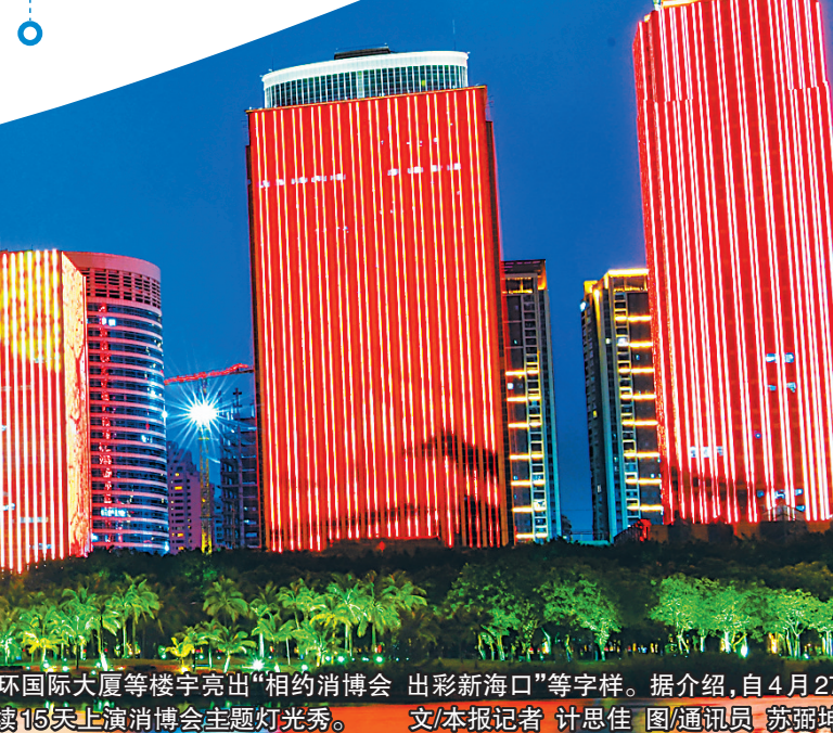
4月26日晚，海口滨海大道中环国际大厦等楼宇亮起“相约消博会 出彩新海口”等字样。据介绍，自4月27日起，海口滨海大道地标建筑将连续15天上演消博会主题灯光秀。