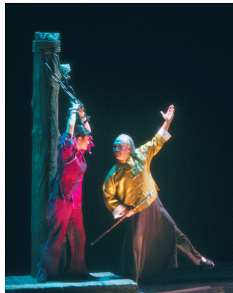
2017年7月，民族歌剧《红色娘子军》在省歌舞剧院上演。