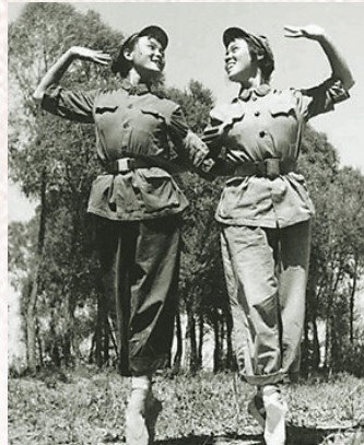
早期芭蕾舞剧《红色娘子军》剧照。

由于红色娘子军的故事发生在琼海，因此琼海还进行相应的实体建筑，从而使得红色娘子军文化和精神传承有了更加直接的依托物，这主要体现为红色娘子军雕像和红色娘子军纪念园。红色娘子军雕像位于琼海市街心公园，于1985年落成。雕像为肩背竹笠和步枪，脚穿草鞋，眺望远方的红色娘子军女战士形象。底座正面镌刻胡耀邦题写的“红色娘子军”五个大字。底座背面镌刻介绍红色娘子军诞生过程和意义的碑文。红色娘子军纪念园于1998年开始兴建，至2000年正式落成开园，主要由和平广场、陈列馆、椰林寨等构成，现在已经成为全国爱国主义教育示范基地。