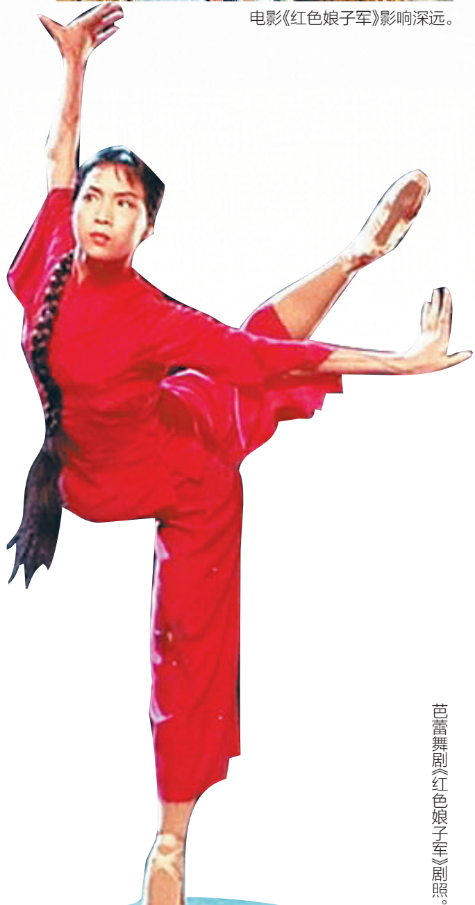
芭蕾舞剧《红色娘子军》剧照。