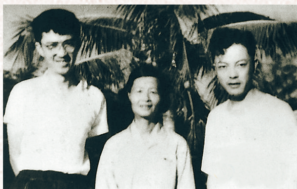
1959年，电影《红色娘子军》编剧梁信(右)、导演谢晋(左)与冯增敏合影。

进入21世纪以来，红色娘子军的故事依然吸引着人们进行文学创作。2004年，花城出版社出版了郭晓东、晓剑创作的长篇小说《红色娘子军》。2014年，庞启江创作的纪实文学作品《红色娘子军传》由线装书局出版。红色娘子军的独特历史地位以及广泛的社会影响力，还将吸引文学爱好者涉足这一题材创作。