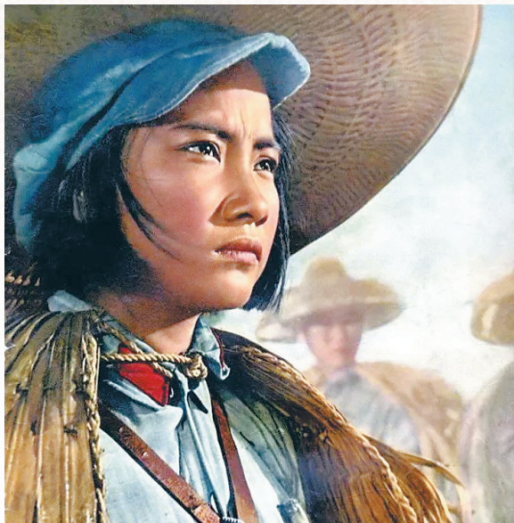
电影《红色娘子军》影响深远。