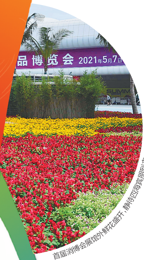
首届消博会展馆外鲜花盛开，静待四海宾朋到来。