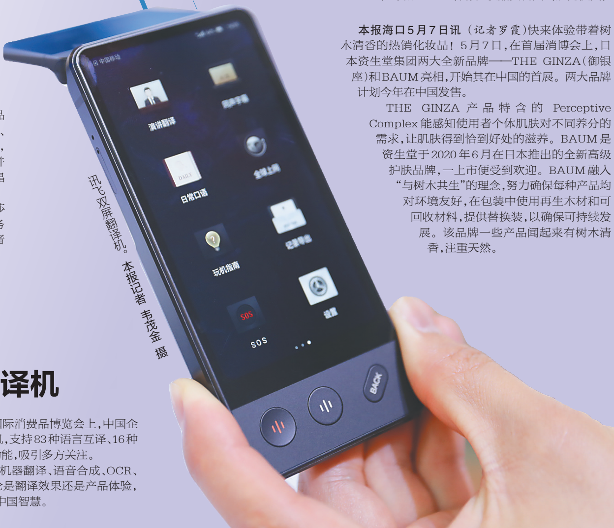
讯飞双屏翻译机。本报记者 李茂金 摄

本报海口5月7日讯（记者罗霞）快来体验带着树木清香的热销化妆品！5月7日，在首届消博会上，日本资生堂集团两大全新品牌——THE GINZA（御银座）和BAUM亮相，开始其在中国的首展。两大品牌计划今年在中国发售。 THE GINZA 产品 特含的 Perceptive Complex 能感知使用者个体肌肤对不同养分的需求，让肌肤得到恰到好处的滋养。BAUM是资生堂于2020年6月在日本推出的全新高级护肤品牌，一上市便受到欢迎。BAUM融入“与树木共生”的理念，努力确保每款产品均对环境友好，在包装中使用再生木材和可回收材料，提供替换装，以确保可持续发展。该品牌一些产品闻起来有树木清香，注重天然。