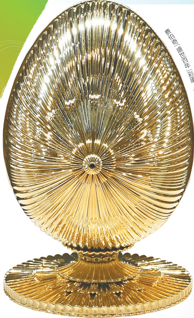
费伯奇“盛世百年”彩蛋。