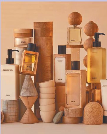
THE GINZA(左)和BAUM(右)化妆品资料图。

本报海口5月7日讯（记者罗霞）快来体验带着树木清香的热销化妆品！5月7日，在首届消博会上，日本资生堂集团两大全新品牌——THE GINZA（御银座）和BAUM亮相，开始其在中国的首展。两大品牌计划今年在中国发售。 THE GINZA 产品 特含的 Perceptive Complex 能感知使用者个体肌肤对不同养分的需求，让肌肤得到恰到好处的滋养。BAUM是资生堂于2020年6月在日本推出的全新高级护肤品牌，一上市便受到欢迎。BAUM融入“与树木共生”的理念，努力确保每款产品均对环境友好，在包装中使用再生木材和可回收材料，提供替换装，以确保可持续发展。该品牌一些产品闻起来有树木清香，注重天然。