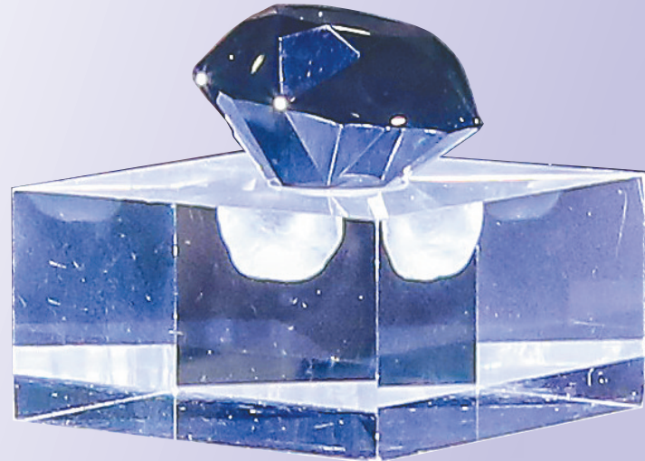
在消博会上展出的卡洛芙黑钻。

本报海口5月7日讯（记者傅人意）88克拉、价值2.5亿元人民币的黑钻长啥样？5月7日，首届中国国际消费品博览会上，在人气极旺的5号国际展馆绿地集团展区，一颗星光熠熠、闪闪发光的黑钻吸引了众多观众围观。 据展台工作人员介绍，展出的是品牌KORLOFF（卡洛芙）黑钻，黑色钻石原石重200克拉，后被精心切割后打造为一枚88克拉的夺目瑰宝“Korloff Noir”，这枚珍宝亦是全世界最大的明亮式圆形切割黑钻。 这颗重达88克拉、有57个切面的黑钻，被列为全球五颗顶级黑钻之一，成为法国卡洛芙珠宝品牌的传世之宝。