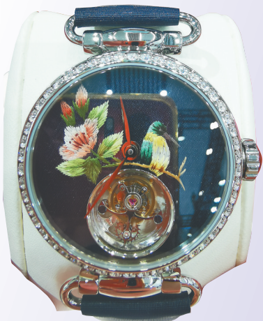
汉辰表业集团国潮腕表。

本报海口5月7日讯（记者王培琳）腕表表盘里有精致的苏绣，有银丝编制的花丝，还有武汉地标黄鹤楼……5月7日，作为复星大快乐板块成员之一，豫园集团旗下汉辰表业集团品牌在消博会上展示了国潮腕表最新的产品系列。 “汉辰表业希望通过此次消博会，能够吸引更多年轻一代关注民族工业、中国制造的成长。”复星国际副总裁、汉辰表业董事长石琨表示，将进一步加大行业资源整合，积极寻求科技创新、潮牌合作，沉下心来专注打造“中国芯”，加快品牌战略规划落地，推出更多适合新时代、跳动“中国芯”的国民腕表。