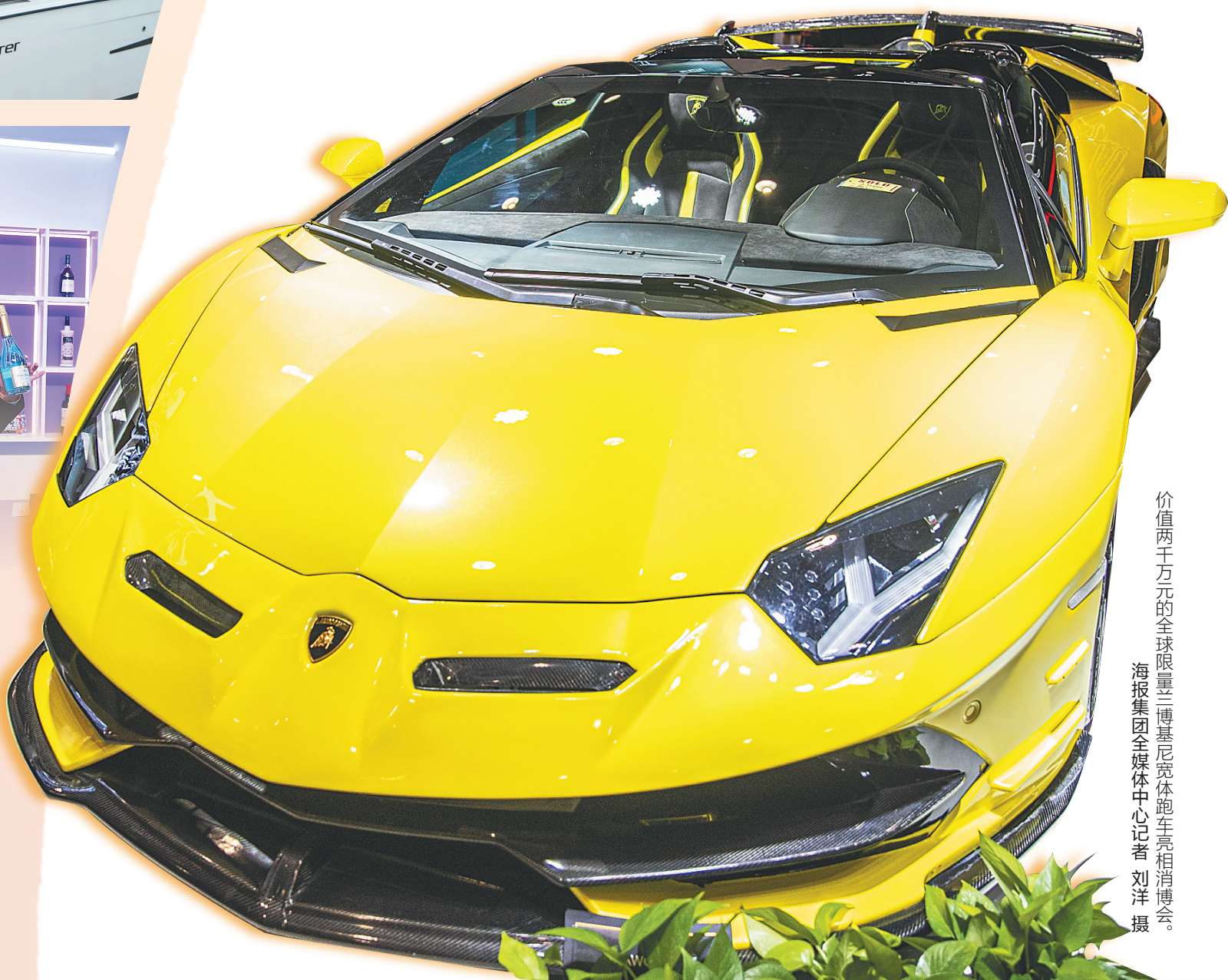
价值两千万元的全球限量兰博基尼跑车亮相消博会。