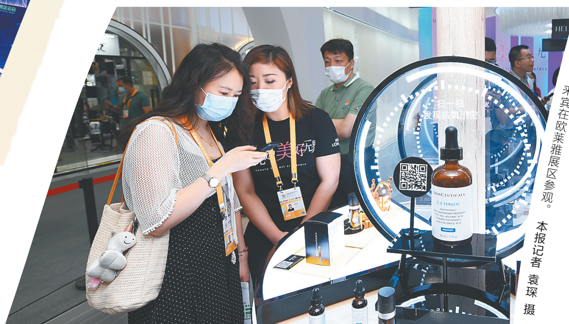
来宾在欧莱雅展区参观。