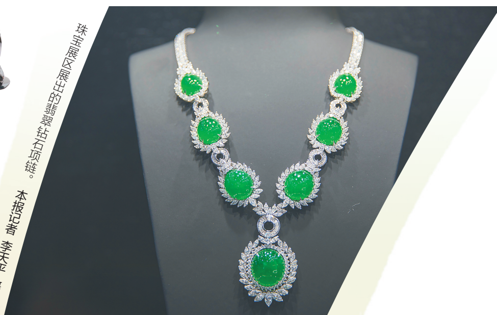
来自非洲的珠宝在展区展出。