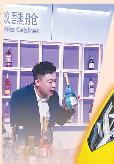
一位主播直播卖货。本报记者 袁琛 摄