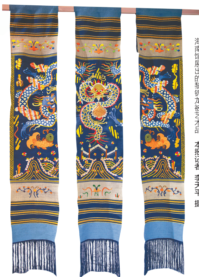
海南馆展出的黎锦龙被艺术品。