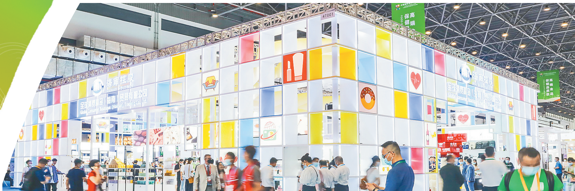
时尚生活展区、高端食品保健品展区多国好物齐聚，吸引众多客商前往。