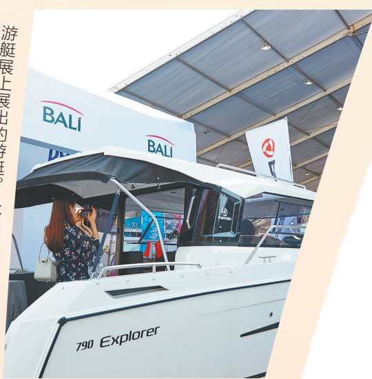
游艇展上展出的游艇。