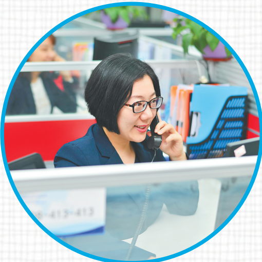
全球投资服务热线工作人员在接听电话。

行“一对一”全流程服务。该局通过建立“企业服务员”制度,建立“横向联动,纵向协调”的工作机制,联合各部门、各市县和重点园区,共同为投资者提供专业服务,协调解决企业项目落户过程中遇到的问题,为全球投资者搭建“一站式”服务平台。 自热线运行以来,海南国际经济发展局及时分享推送自贸港新政策措施,同时推动有较大投资意向的项目至海南重点园区。通过与各市县、重点园区的共同努力,一大批来电咨询企业成功在海南注册公司,参与到自贸港建设中。