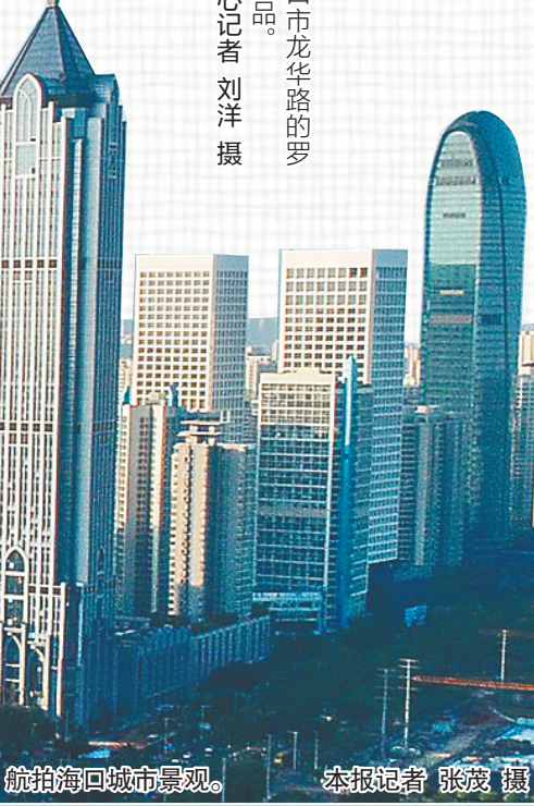
航拍海口城市景观。