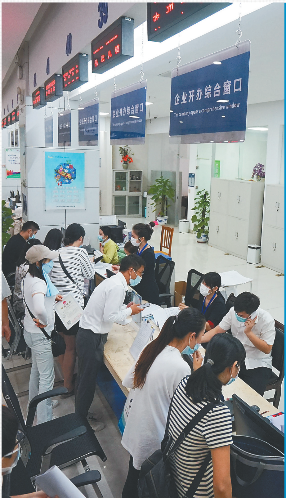
在三亚政务服务中心，工作人员正在提供企业开办、注册登记等服务。

优化营商环境是一场不停步的“马拉松”，任重而道远。站在着力打造国内国际双循环的重要交汇点，海南自贸港将为广大企业投资兴业提供更好环境和更广平台。