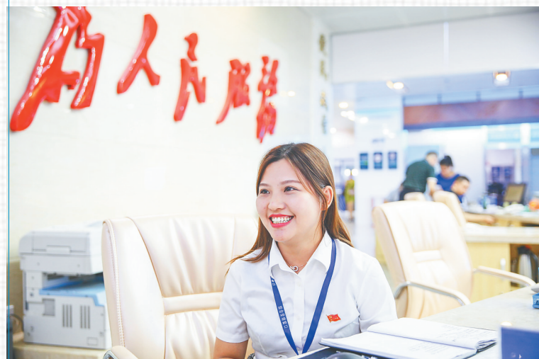
在省政务服务中心审批服务综合窗口，工作人员在解答企业人员的咨询并受理所交的材料。