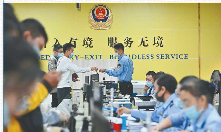
海口市公安局美兰办证中心的民警们正在为申请引进人才落户的人员提供咨询和办理服务。