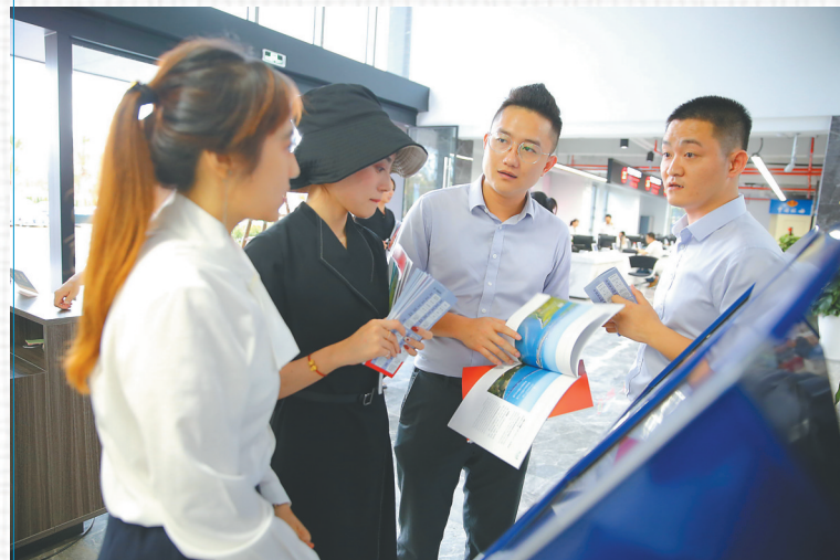
在海口江东新区政务服务中心，工作人员给企业和个人提供咨询服务。