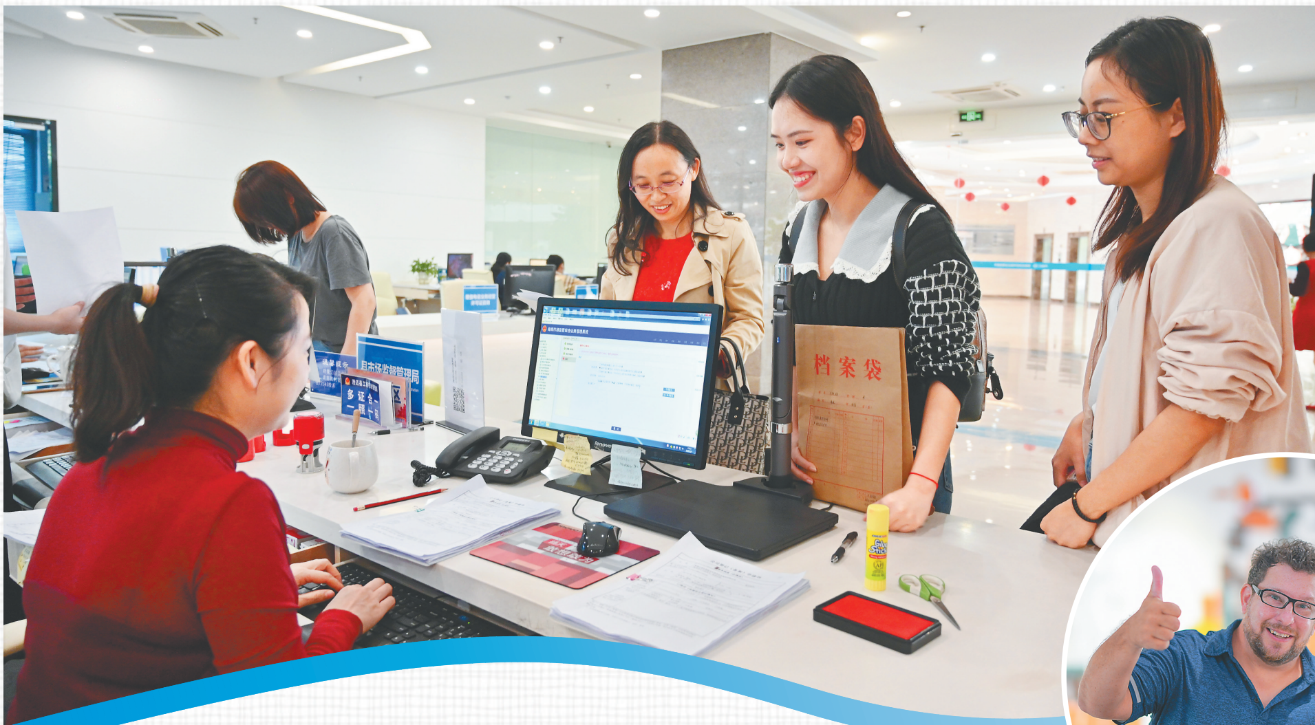
海南生态软件园实行极简审批，让企业感受到极大便利。