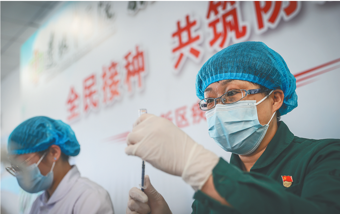
“五一”假期期间,各地疫苗接种不放松。图为沈阳市沈北新区医护人员为市民接种疫苗。

证,续种相同种类的疫苗,并在接种凭证上登记相应剂次的接种信息。 国务院联防联控机制强调,要进一步提高管理水平,坚决杜绝接种服务按照户籍“一刀切”的情况。 据了解,国务院联防联控机制已印发预防接种凭证参考格式,供各区市使用。