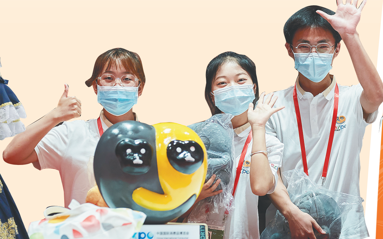
消博会学生志愿者。