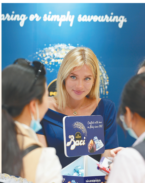
产品推荐。