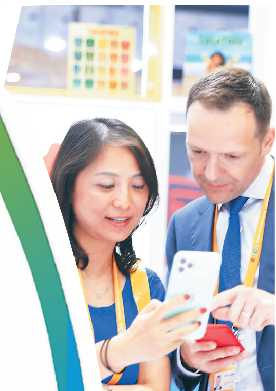
客商在了解产品情况。

八方客聚，有说有笑。 5月8日，首届中国国际消费品博览会（以下简称消博会）开展第二天，恰逢“世界微笑日”。 笑，代表着阳光与温暖，传递满满的正能量。“微笑”，也是消博会上的一道靓丽风景。在展会上，海南日报记者现场捕捉到来宾们一个个微笑的瞬间。 参展商们笑迎八方客，各个展区集纳“品质尖货”令人眼花缭乱，惊喜不断…… 展会志愿者以微笑传递志愿精神，让“微笑”成为海南最闪亮的名片…… 客商们在微笑攀谈中碰撞思想火花，共享消博会和