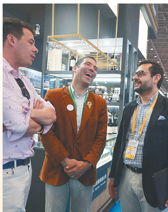
客商交流。