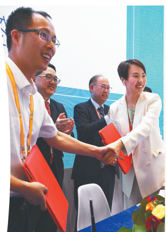
洽谈签约。本报记者 王凯 摄