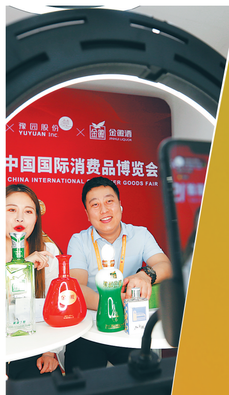
微笑直播。本报记者 袁琛 摄

自贸港新机遇。大家纷纷表示，希望通过消博会这一窗口充分了解自贸港政策，加强与海南之间的经济交流合作，共享中国进一步对外开放的红利。 一张张笑脸，一次次满怀期待与惊喜的交流，不仅是客商对中国市场的青睐，更是对参与和融入自贸港建设的热切期盼，充分彰显了海南自贸港正成为中国市场的新亮点、兴奋点。 海南自贸港，中国大市场，世界大机遇。消博会，这一亚太地区规模最大的精品展，在大海之南交织出一幅中国与世界、海南与世界深度交融、互利共赢的生动图景。