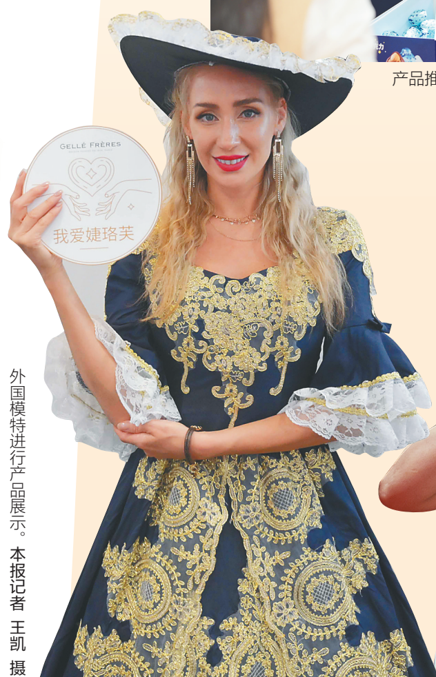
外国模特进行产品展示。