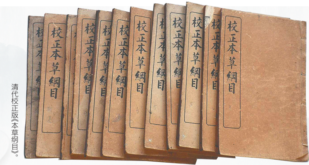
清代校正版《本草纲目》。