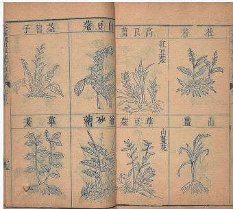
《本草纲目》内页的草药图。

5月2日，央视文化节目《典籍里的中国》第四期《本草纲目》播出。在节目中，观众与李时珍进行了跨越400多年的对话，看到了一代医者为守护百姓安康“逆水行船”的一生。