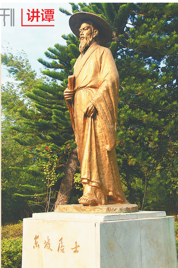
海南儋州东坡书院中的苏东坡塑像。

“垂天雌霓云端下，快意雄风海上来。”1502年明代进士唐胄《重建儋州学记》，加双引号引用流传四百年的一句话“琼之有士始乎儋，琼之士亦莫盛乎儋。”始是四百年前“宋苏文忠公南迁时，琼士仅得姜君弼、黎子云、王公辅、符林数人，而黎、王、符皆儋产。”姜唐佐，字君弼。盛是“厥后，王霞举、符确辈继出，儋遂为名州，而况积至今日之盛乎。”同时，唐胄也善意提醒“岂徒自庆曰‘琼之有士始乎儋，琼之士亦莫盛乎