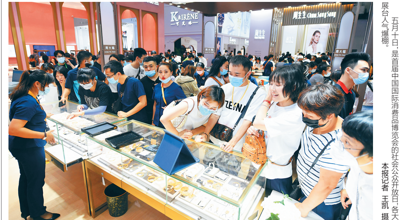
五月十日，是首届中国国际消费品博览会的社会公众开放日，各大展台人气爆棚。