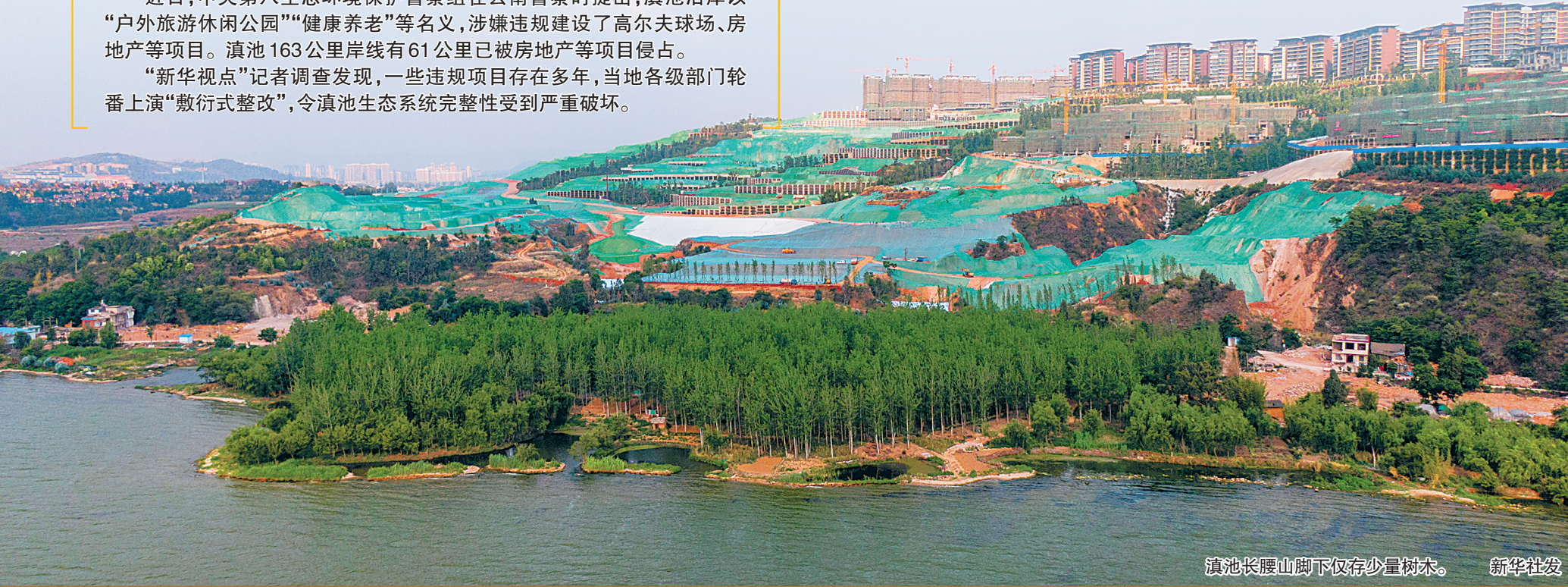
滇池长腰山脚下仅存少量树木。

近日,中央第八生态环境保护督察组在云南督察时提出,滇池沿岸以“户外旅游休闲公园”“健康养老”等名义,涉嫌违规建设了高尔夫球场、房地产等项目。滇池163公里岸线有61公里已被房地产等项目侵占。 “新华视点”记者调查发现,一些违规项目存在多年,当地各级部门轮番上演“敷衍式整改”,令滇池生态系统完整性受到严重破坏。