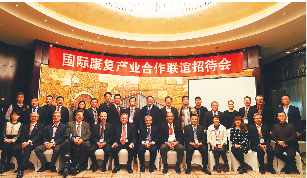
国际康复产业博览会筹备研讨会。