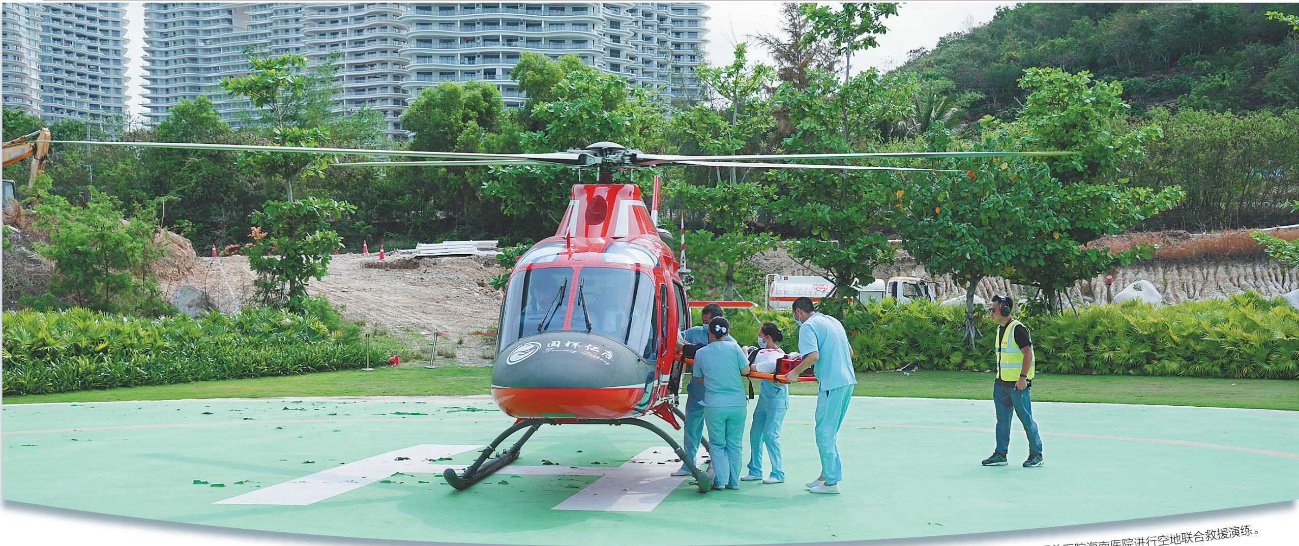
乐东黎族自治县与解放军总医院海南医院进行空地联合救援演练。