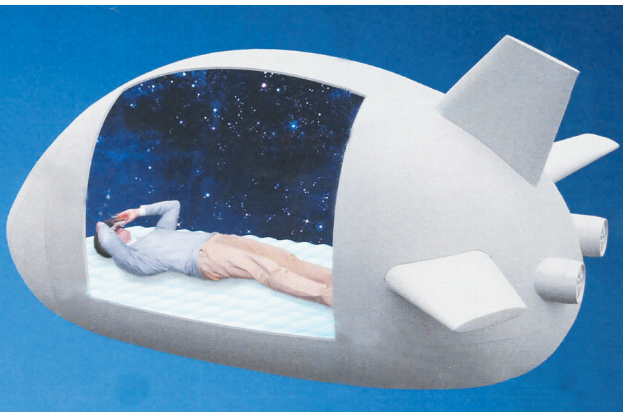
新一代心神修复太空舱。