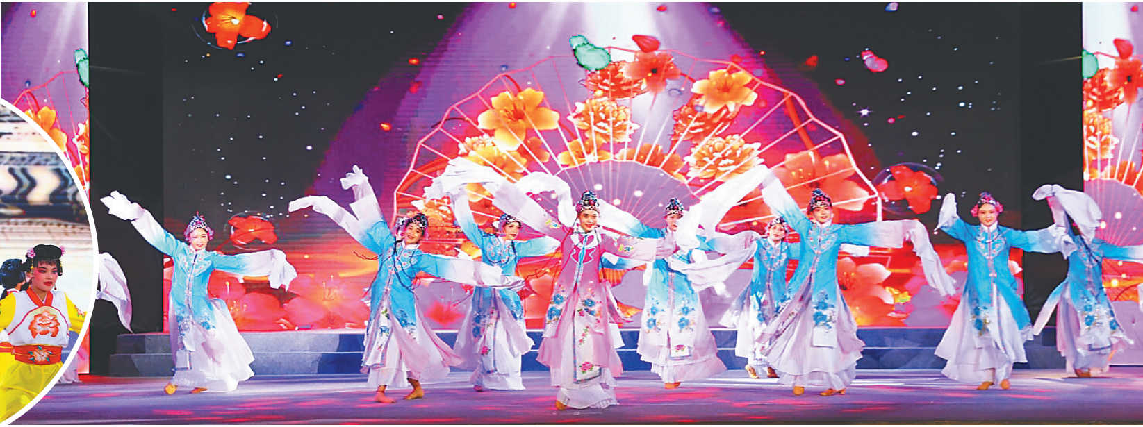
五月十八日晚,“活力新定安 琼韵醉古城”琼剧主题晚会在定安县定城镇拉开帷幕。