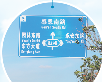
东方主要道路上方的外语标识标牌。