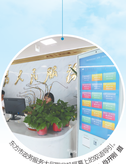
东方政务服务大厅取号机屏幕上的双语导引。