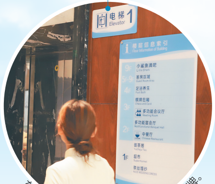
东方市民智海景大酒店内的外语标识标牌。