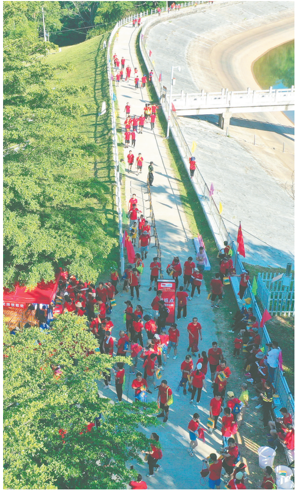
市民在太平水库补给站补充能量。

本报讯（海报集团全媒体中心记者邱肖帅）5月22日上午，由五指山市总工会主办的迎接建党100周年暨庆祝“五一”国际劳动节健身跑活动在五指山市举行。活动受到五指山市社会各界踊跃参加，参与人数超过1500人，活动图片直播在线观看人数超过50万次。