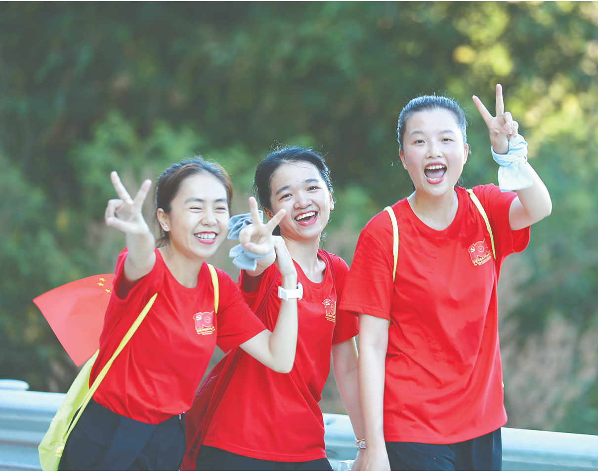
市民在欢声笑语中徒步。