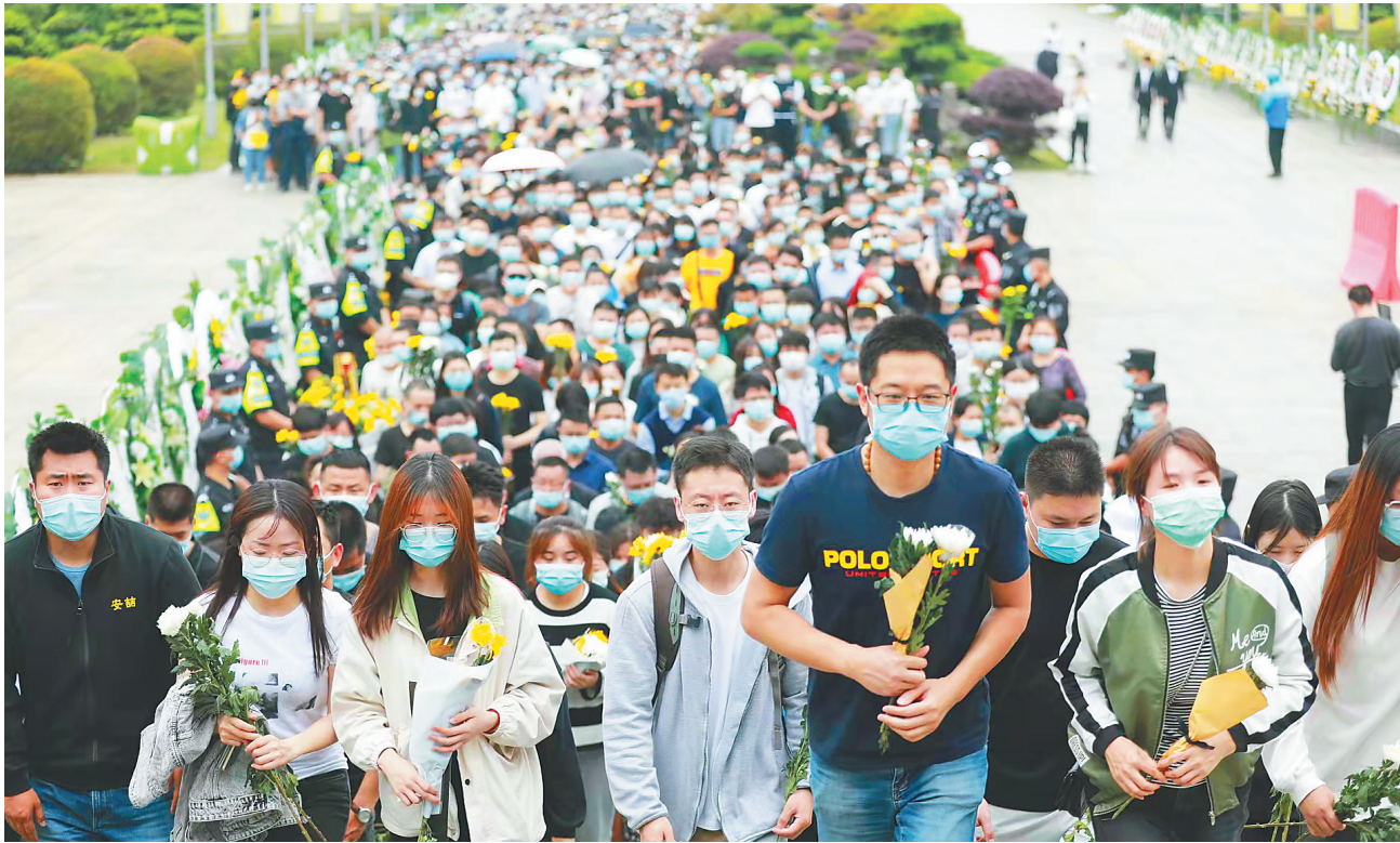
5月24日,大量民众前往湖南长沙明阳山殡仪馆悼念袁隆平院士。

湖南杂交水稻研究中心的试验田旁,整齐码放的菊花映着日光,如成熟的稻穗,铺开一地金黄。田间,茁壮的秧苗正向阳生长……(本报长沙5月24日电)