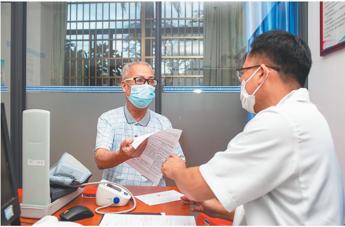
5月28日，在海口市演丰镇中心卫生院，一位要接种新冠疫苗的老人做完身体检查后询问医生注意事项。

语服务、统一接送等措施。”龙华区残联一位工作人员介绍，考虑到残疾人出行不便和对疫苗接种信息和知识的接触较少，区残联专门安排工作人员主动对接对接残障人士，并安排车辆接送，为他们准备好口罩、测量体温，在龙华区疫苗接种系统提前预约登记。接种现场，还有医务人员和残联工作人员全程陪同，提供优先、优质、快速的服务。 龙华区疫情防控指挥部有关负责人提醒广大市民群众，符合新冠疫苗接种条件的18岁以上市民，请尽快到龙华区辖区疫苗接种点接种，可提前线上预约或带身份证、口罩直接到接种点登记接种。目前，龙华区辖区49个固定接种点每天接种新冠疫苗的工作时间为每日8:00—11:30、14:30—17:30、19:00—22:00；10辆疫苗流动接种车工作时间为每日8:00—11:30、16:00—22:00。