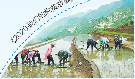
《2020 我们的脱贫故事》之《落地生根》