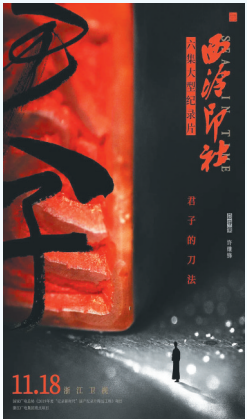
纪录片《西泠印社》海报