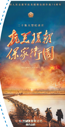
纪录片《抗美援朝保家卫国》