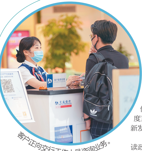
客户正向交行工作人员咨询业务。