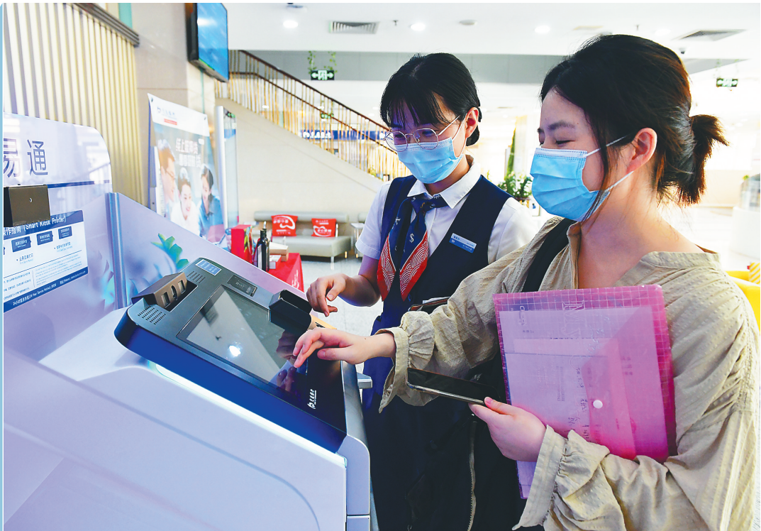
工作人员为客户办理业务。