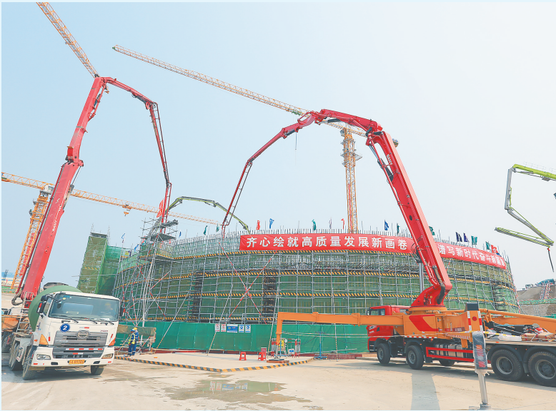
海南昌江核电二期工程3号机组正在加紧施工。

本报石碌6月3日电（记者林书喜 特约记者黄兆雪）6月3日上午，如火的烈日炙烤着大地，在海南昌江核电二期工程项目建设工地，施工人员冒着酷暑在各自的工作面作业，在3号机组外圈，几台混凝土泵车伸着长长的铁臂输送混凝土浇筑3号机组的核岛。“整个项目共投入40多台设备和1700名工人同时施工。”华能海南昌江核电有限公司工程管理部主任王海波告诉海南日报记者。