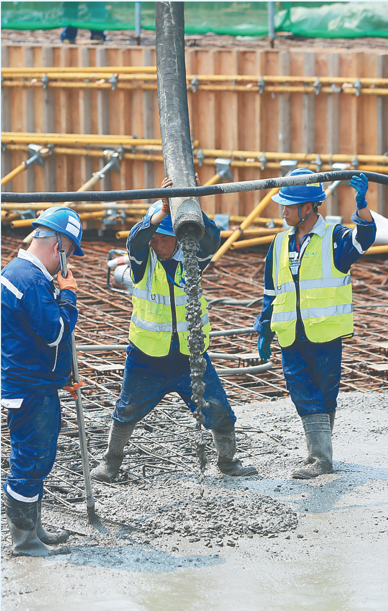
昌江核电二期工程项目建设工地上，工人在浇筑3号机组核岛底板。