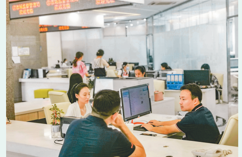
在海南生态软件园企业服务超市，工作人员正在为企业服务。