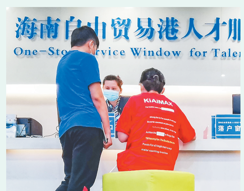
在海南生态软件园孵化楼，工作人员在有条不紊办理业务。