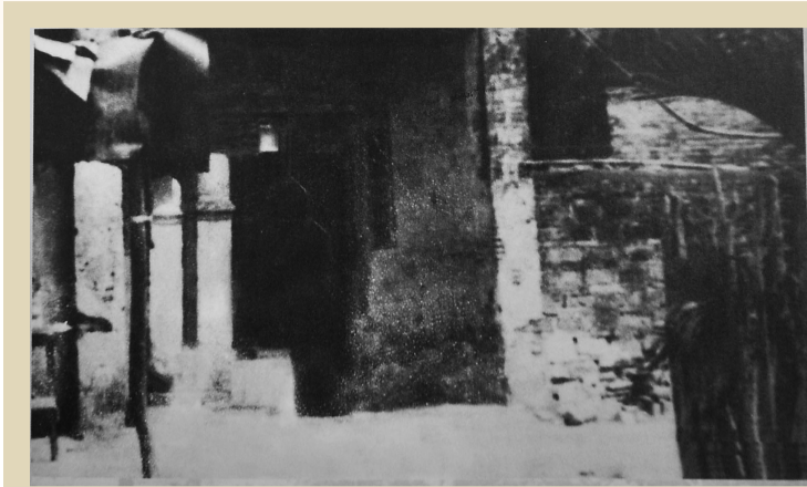
↑ 1928年中共崖县县委旧址。 → 1927年创建的崖三区苏维埃政府办公室旧址。