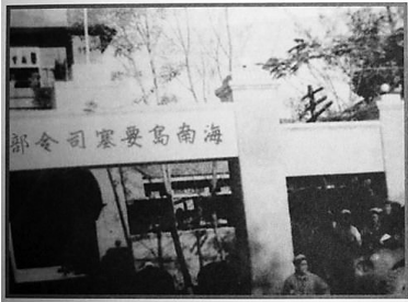
1950年4月30日，中国人民解放军占领榆林国民党军要塞司令部。

除了参军入伍，崖县人民还积极筹款筹粮，支援琼崖纵队的前线战斗。据统计，1928年崖县和榆三特区人民捐献光洋3000多元，国币183800元。同时，他们还通过没收官僚、奸商的粮财、物资，向商人、富户和进步人士摊借等方式筹措钱粮支前。我党领导的崖县稽征队和梅山乡后备队在角头海面没收奸商一船铁丝和物资1万多斤，变卖得300元光洋上缴；在望楼港又没收奸商一船大米几十包用以支援部队。这些钱粮解除了琼崖纵队作战的后顾之忧，有利于琼崖解放战争的顺利进行。