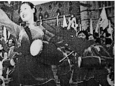
1950年4月30日，三亚解放，市民上街游行欢庆胜利。

随后一两年，崖县党组织积极进行党建政建，成立了崖县四五联区委，建立崖县民主政府和榆三县民主政府，积极武装人民群众，手中的武装力量大为增强，先后进行了击毙乐罗乡反动乡长吉锋，拔除了千家据点、梅东关公庙敌据点等一系列战斗，取得不错的战果。