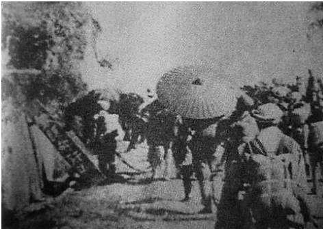
中国人民解放军向榆林奔袭，追歼国民党溃敌。

4月30日，解放军40军和琼纵部队追打残敌，直达榆林、三亚地区。次日我军又乘胜进占崖县县城，崖县全境宣告解放，崖县历史翻开了新的一页。📖