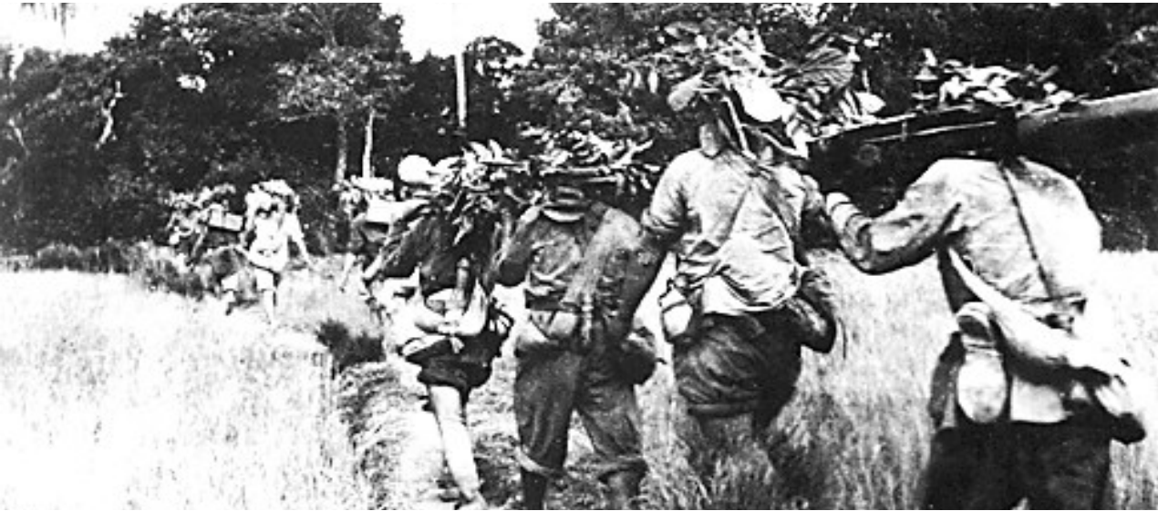
1950年4月，第40军第119师第355团从东线穿越椰林荒岭向榆林港追击逃敌。（资料图）