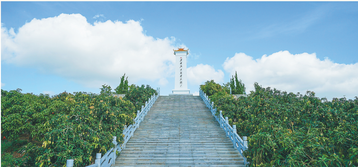
三亚仲田岭革命烈士纪念碑。

“仲田岭革命根据地创建于1927年，是中国最南端的苏区。1928年夏，中共崖县县委书记张开泰从‘保亭营事件’中突围后，带着枪伤，艰苦跋涉十多天到了陵水，又几经周转潜回仲田岭，同岭上坚持斗争的同志们会合。”年逾七旬的三亚市海棠区仲田岭老红军后代宣讲团副团长占达龙对于这段历史早熟烂于心，可每一次讲到这里，他依旧忍不住感慨：“革命火种得以保存，而后还在仲田岭上熊熊燃起，这里留下了太多英雄故事。”