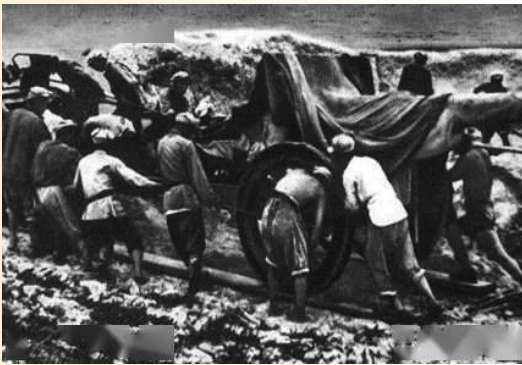
仲田岭当地村民积极送粮筹粮，解决部队后勤补给问题，支援抗战。