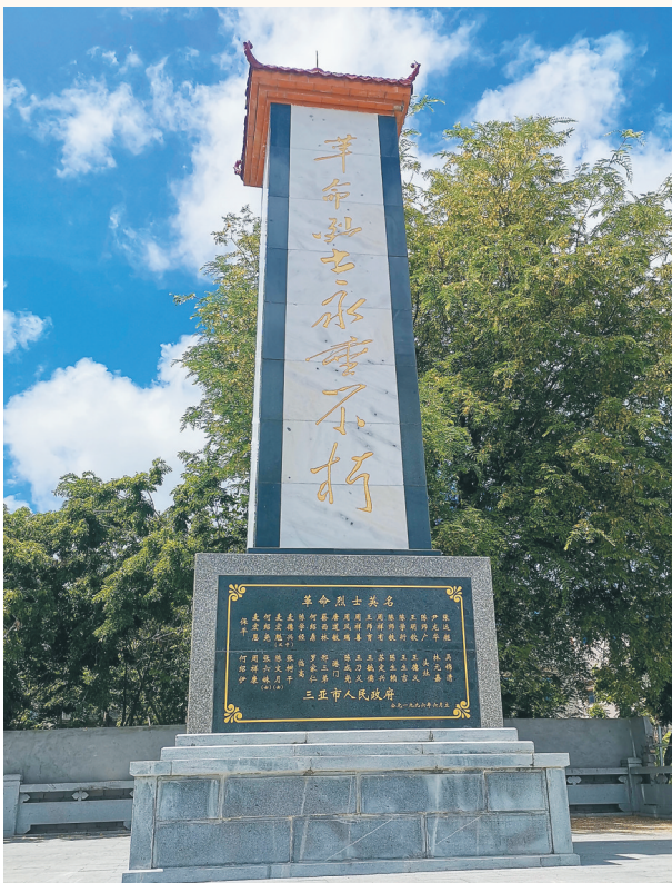
保平村革命公园里的烈士纪念碑。

保平村文教昌盛，先后有三位宰相被贬谪到此生活，在他们的影响下，明清两代保平就培养贡生40多人。1899年，麦宏恩出生于保平村一个农民家庭，他自小聪明好学，从小学、中学直到广州国民大学，都是优秀学生。在广州读书期间，受到马列主义影响，积极参加革命活动，1923年当选为广州国民大学学生会主席，1924年光荣加入中国共产党。此后，受党的委派，他两次从广州回家乡开展革命活动。与共产党人黎茂萱、陈英才、陈世训等人一起，在保平、港门、崖城一带办平民学校，演白话剧宣传马列主义，建立党组织和革命武装。1926年，他们在崖城一高秘密建立崖县第一个党支部——东南支部，接着成立崖县农民协会，麦宏恩当选为首届农会主席。