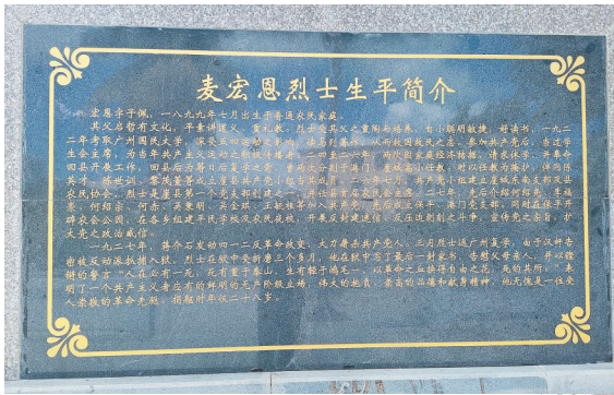
碑石上的麦宏恩生平。

罗灯光写道：在这封家信中，麦宏恩烈士用“矢志救人，类于自由、国家于平等”，誓“以革命之血，换得自由之花”来表露初心。他参与建立党组织，领导农民运动，就是对初心的施展。烈士进而阐述，如果他的死能“唤起世界人类共争自由”，就“死得其所”，他是为抱负、为初心而死，视死如归，这样的死重于泰山，由此安慰父母不要因为他的死而过度悲伤。每读至此，我的心都被强烈地震撼着。