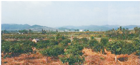
中共陵崖县委遗址位于三亚市藤桥镇（今海棠湾镇）仲田岭，如今成为果园。