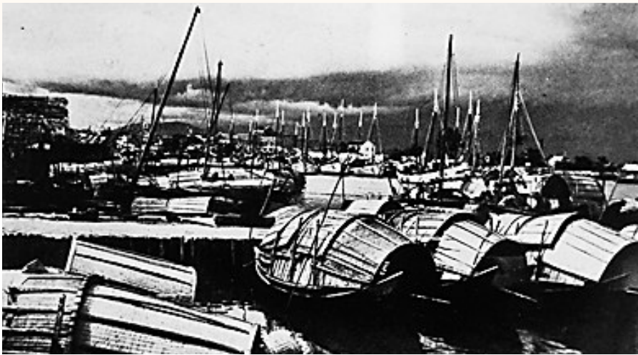
1940年代的陵水新村港。战争和解放战争都做出了贡献。当地渔民对抗日