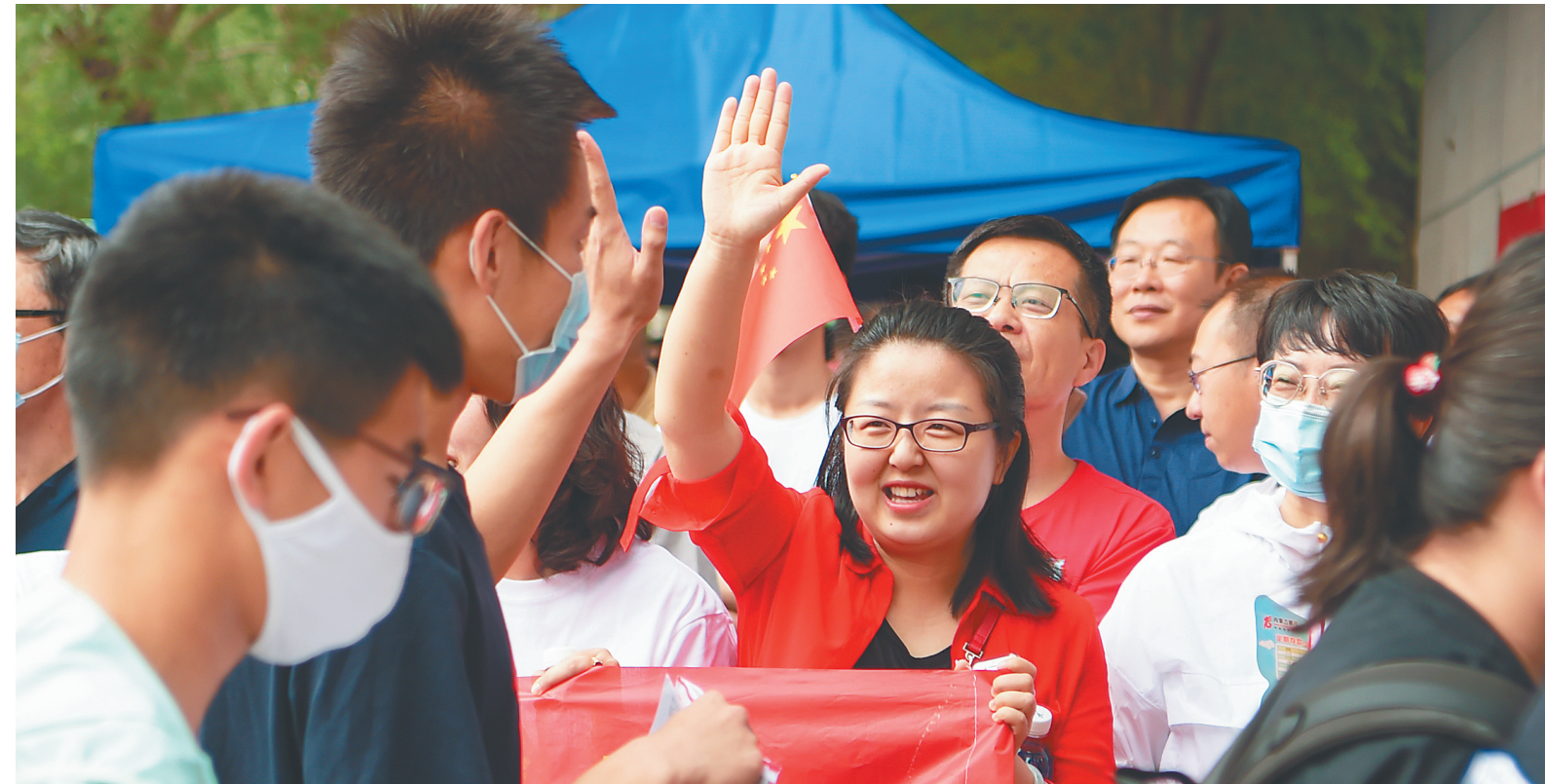
6月7日，老师在内蒙古呼和浩特市第二中学（西校区）考点门口鼓励考生。