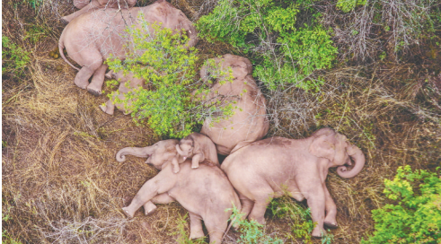
6月7日在昆明市晋宁区夕阳彝族乡拍摄的野象。