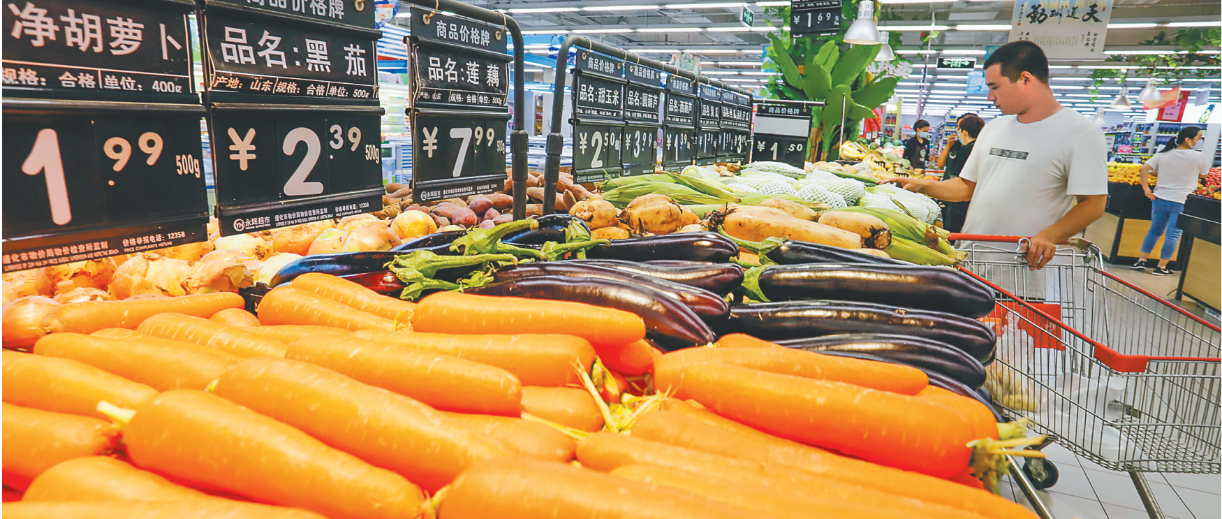
六月九日，消费者在河北省遵化市一家超市选购蔬菜。