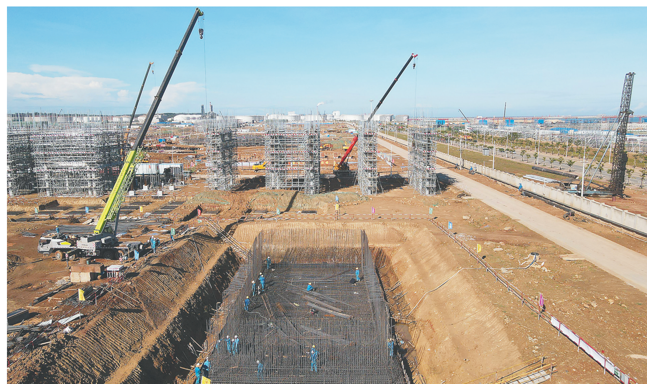
海南炼化百万吨乙烯项目:建设按下“快进键”

近日,洋浦经济开发区海南炼化百万吨乙烯项目施工现场热火朝天。截至目前,该项目设计进度达到67%,土建基础施工整体完成73%,为下半年进入无土化安装创造条件。项目竣工投产后将直接拉动超1000亿元的下游产业,助力海南自贸港建设。