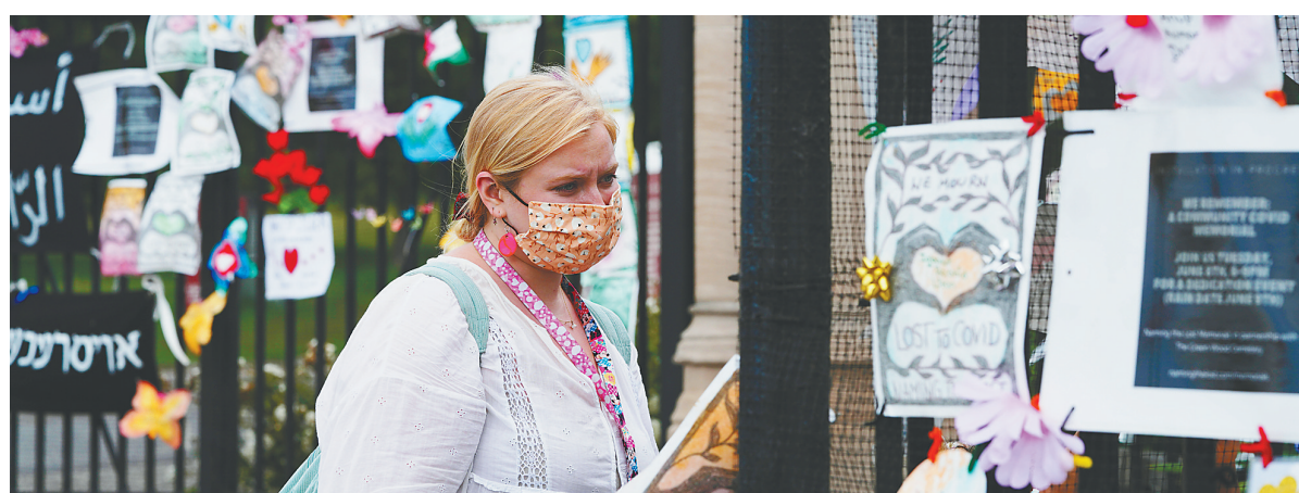
6月14日,一名女子在美国纽约一处墓地外为新冠死者设立的纪念装置旁驻足。

当地时间15日21时15分,纽约州包括曼哈顿、尼亚加拉大瀑布等10个地点同时燃放烟火,帝国大厦、世贸大厦等纽约州地标性建筑同时亮起蓝、金两色,庆祝纽约州防疫“里程碑”——70%的18岁以上人口已接种至少一剂新冠疫苗。纽约州长安德鲁·科莫同日宣布,全州提前达到联邦政府提出的到7月4日完成70%成年人接种疫苗的目标,全州大部分防疫措施即时解除。而这个时间点恰逢美国疫情中的另一个纪录——全美新冠死亡人数突破60万。在全球381万多新冠死亡总人数中,美国占了近16%。