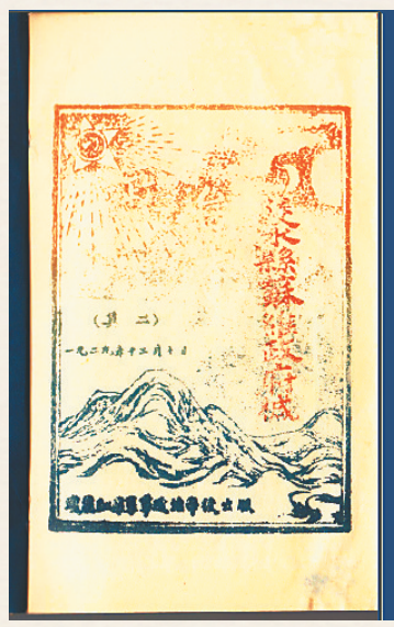
1929年12月10日,陵水县苏维埃政府印刷的《政治大纲》扉页。

为庆祝中国共产党建党一百周年,海南省测绘地理信息局联合中共海南省委党史研究室推出《海南红色地图》,内容涵盖海南岛红色印记、红色娘子军活动示意图、不同时期的革命活动作战示意图,以及海南省爱国主义教育基地分布图、海南岛红色旅游推荐路线图等。海南周刊本期起推出“庆祝中国共产党建党百年——海南红色地图”系列报道,解读《海南红色地图》背后的故事。